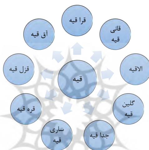
نمودار (۲) جای‌نام‌های به دست آمده که از تکواژ «قیه»

یکی دیگر از تکواژهای جای‌نام‌ها که به نوعی از تکواژهای پربسامد است و به محقق در تحلیل کمک می‌رساند، «قیه» است. «قیه» در زبان ترکی آذری به معنای صخره و تخته‌سنگ است. این کلمه در ترکی استانبولی به معنای «کایا» kaya تلفظ می‌شود (رضایی، ۱۳۹۵: ۴۴۲). «قیه» در بین جای‌نام‌ها با رنگ‌واژه‌های زیادی هم به کار رفته است. در ادامه نمونه‌ای از آنها در نمودار و جدول آمده است: