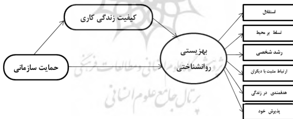
شکل ۱: مدل مفهومی کیفیت زندگی کاری در رابطه بین حمایت سازمانی و بهزیستی روانشناختی

مدل پیشنهادی بررسی رابطه بین حمایت سازمانی و بهزیستی روانشناختی با نقش میانجی کیفیت زندگی کاری معلمان زن در پسا کرونا در شکل ۱ ارائه شده است.