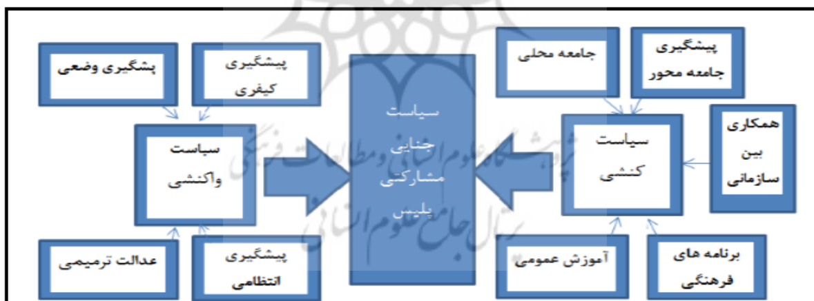
شکل ۳. سیاست جنایی مشارکتی پلیس در پیشگیری از جرایم در شهرستان بوئین زهرا

بر این اساس سیاست جنایی مشارکتی کنشی از ۵ مضمون اصلی و ۳۹ مضمون فرعی و سیاست جنایی مشارکتی واکنشی از ۴ مضمون اصلی و ۴۰ مضمون فرعی تشکیل شده است.