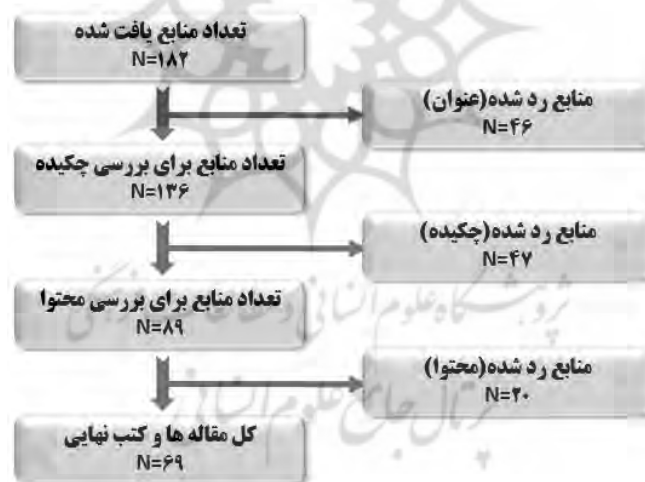
شکل ۲: فرایند جستجو و گزینش کتب و مقاله‌های مرتبط در مطالعه حاضر

در گام سوم تحت عنوان «جستجو و انتخاب کتب و مقاله‌های مرتبط» و در فرایند جستجو، پژوهشگر پارامترهای مختلفی نظیر عنوان، چکیده، واژه‌های کلیدی و محتوا و نظایر آن در زمینه بررسی کیفیت پژوهش‌های مرتبط را در نظر گرفته و کتب و مقاله‌هایی را که با سؤال و هدف پژوهش تناسبی نداشته‌اند را حذف نموده است. همچنانکه در شکل ذیل ملاحظه می‌گردد در مرحله آغازین غربالگری، از میان ۱۸۲ مقاله شناسایی شده، ۴۶ مقاله یافت شده که دارای عنوان و موضوعی متفاوت نسبت به موضوع خاص مورد بررسی در این مطالعه بود، حذف گردید. در مرحله دوم و از طریق مطالعه دقیق چکیده و تعیین اینکه یافته‌های به دست آمده در آن پژوهش، ارتباطی با حوزه مطالعاتی این تحقیق نداشته است، نیز ۴۷ مقاله حذف گردید. لذا در این مرحله، ۸۹ مقاله به منظور بررسی میزان همخوانی محتوایی با حوزه مورد مطالعه در تحقیق حاضر و در نتیجه ارائه اطلاعات پیرامون سؤالات این پژوهش، به طور کامل مورد بررسی و ارزیابی قرار گرفت و ۲۰ مقاله دیگر حذف گردید و در نهایت، ۶۹ مقاله مناسب تعیین و در این مطالعه، مورد تجزیه و تحلیل و استفاده قرار گرفت.