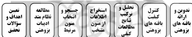
شکل ۱: مراحل هفتگانه الگوی فراترکیب ساندوسکی و باروسو (۲۰۰۷)

روش فراترکیب ۱ ، یکی از مجموع روش‌های فرامطالعه ۲ است. توضیح آن که روش فرامطالعه به معنای بررسی، ترکیب و تحلیل نظام‌مند پژوهش‌های گذشته و یکی از روش‌های تحقیق کیفی ۳ پرکاربرد است که امروزه توسط پژوهشگران و مدیران، بسیار مورد توجه و استفاده قرار گرفته است. روش فرامطالعه در حقیقت مشتمل بر چهار روش: الف) فراتحلیل ۴ ، ب) فراروش ۵ ، ج) فراترکیب ۶ و د) فراترکیب تعریف می‌گردد (Bench and Day, 2010). روش فراترکیب یا متاستز یک روش تحقیق کیفی است که به پژوهش درباره پژوهش‌های دیگر یا به تعبیری دیگر، به ارزشیابی تحقیقات گذشته می‌پردازد و از آن، تحت عنوان ارزشیابی ارزشیابی‌ها نیز یاد می‌شود. در حقیقت فراترکیب فرایند جستجو، ارزیابی، ترکیب و تفسیر مطالعات گذشته در یک حوزه خاص است. به تعبیری دیگر، فراترکیب مطالعه‌ای کیفی به منظور تفسیر نتایج تحقیقات پیشین و تولید و کاربرد دانش، از این طریق است (Sandelowski and Barroso, 2007). همچنانکه در شکل ذیل ملاحظه می‌گردد در این مطالعه و به منظور بهره‌گیری از روش فراترکیب از الگوی هفت مرحله‌ای ساندوسکی و باروسو (۲۰۰۷)، استفاده شده است.