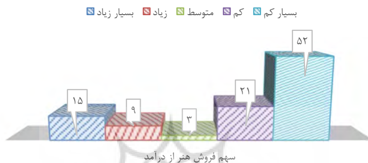
نمودار ۱. چندشغلی هنرمندان خوش‌نویس مشهد (یافته‌های پژوهش)

نمونه‌ی این پژوهش نیز تقریباً ۷۳٪ از خوش‌نویسان مشهد بیان داشتند که درآمد حاصل از فروش آثار هنری، تنها بخش کوچکی از عایدی‌های آن‌ها را شامل می‌شود. ۱ این شواهد در حمایت از این ادعا است که هنرمندان درآمدهای سایر مشاغل مرتبط با هنر و حتی مشاغل غیرهنری خود را صرف تأمین معاش و یا تأمین مالی پروژه‌ها و تولیدات هنری خود می‌کنند (نمودار ۱).