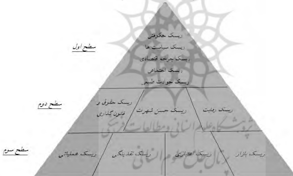
شکل ۱: انواع ریسک‌ها در نهادهای مالی

سطح سوم، ریسک‌هایی هستند که بر نهاد مالی تأثیر می‌گذارند ولی نهاد مالی با اعمال روش‌ها و ابزارهایی می‌تواند آن‌ها را تحت کنترل خود در آورد و مدیریت کند (رحیمی و محمدی، ۱۳۸۸، ص ۴۲).