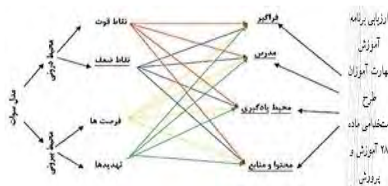
شکل ۱. مدل مفهومی تحقیق

راهبردی آتی فراهم گردد. از سویی ابعاد و وجوه شناسایی شده به تناسب اهمیت و ضریب کاربردی بودن آن‌ها رتبه‌بندی شده‌اند. در ادامه الگوی مفهومی مطالعه حاضر ارائه شده است.