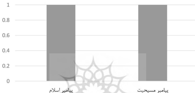
شکل ۳: نمودار فراوانی نقل از منابع غیریهودی در باب «تواضع» الهدایة

چنان که پیداست، ابن یاقودا به منابع برون دینی، از جمله منابع اسلامی و مسیحی توجه داشته و در این باب از الهدایة نیز در جای جای اثر خود، از آن مراجع اقتباس نموده است. بی پروایی عارف یهودی در اخذ از منابع غیر خودی، به ویژه به عنوان شاهد و مثال - در حالی که شریعت یهود را برترین شریعت می داند - ( ابن یاقودا ، ۲۰۱۰، ص ۳۴۳) گویای این نکته است که برای وی غنابخشی و پربار کردن مباحث سلوکی مهم بوده است، نه اینکه گوینده چه کسی و از پیروان کدام ادیان باشد.