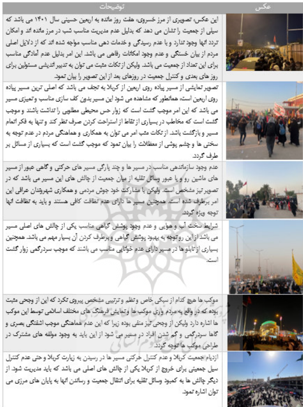
جدول ۷: بازدید میدانی