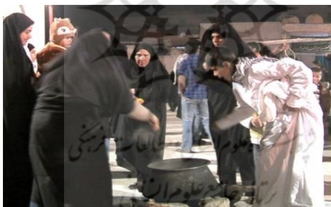
تصویر ۳. کوی جبری (سیاهگلا)، تابستان ۱۴۰۰