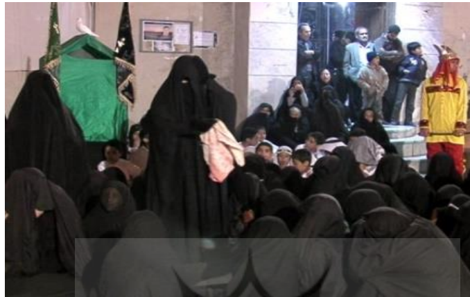
تصویر ۲. کوی جبری (سیاهگلا)، تابستان ۱۴۰۰

می‌انجامد که دین نه تنها به زندگی معنا می‌بخشد، بلکه باعث ایجاد انسجام بخشی در جامعه نیز می‌شود.