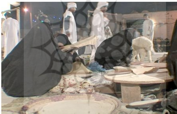
تصویر ۴. کوی جبری (سیاهگلا)، تابستان ۱۴۰۰

هدایت بخشی رفتار انسان باشد» (Geertz, 1973, p.126). در پایان باید این نکته را یادآور شد که همه مناسک دینی از نگاه گیرتز نوعی درام اجتماعی است؛ چیزی شبیه به تئاتر که خود هدف و غایت است، نه وسیله‌ای برای رسیدن به هدفی دیگر. گیرتز جمع شدن انسان‌ها در تشریفات آیینی را به منظور تجدید ایمان جمعی می‌داند و دیدگاهش به نظریه دورکیم که دین را اجتماع انسان‌ها می‌داند، نزدیک می‌شود. گیرتز همچنین بر این باور است که برای بازشناسی دین، باید به سراغ مناسک و آیین‌ها رفت و سپس با فرهنگ آن مردم، نمادها و اسطوره‌ها و روایت دینی و ادبی آن‌ها را شناخت.