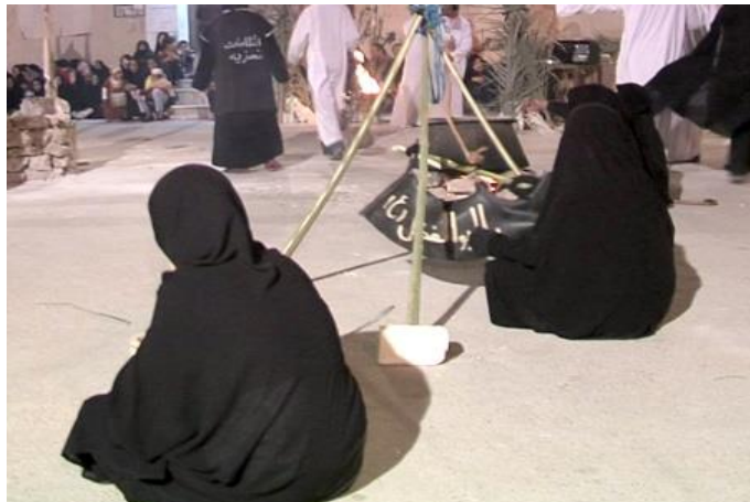
تصویر ۵. کوی جبری (سیاهگلا)، تابستان ۱۴۰۰