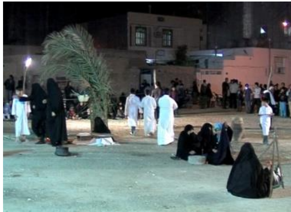
تصویر ۱. کوی باغ زهرا (تابستان ۱۴۰۰)