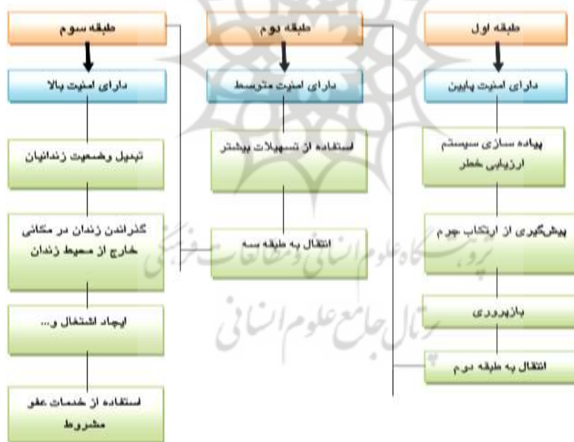
شکل ۱- طبقه‌بندی زندانیان در صورت کاربست قانون آمریکا

کاهش جمعیت کیفری زندانیان به طبقات مختلف اختصاص یافته است و تسهیلات مربوط به زندانیان بر اساس تقسیم‌بندی صورت‌گرفته، شامل زندان‌های با امنیت پایین، متوسط و با امنیت بالا می‌گردد و نتایج مورد انتظار قانون اولین گام آمریکا، هم در خصوص کاهش جمعیت کیفری زندانیان و هم بهبود کیفیت زندگی بعد از محکومیت زندانیان، به دست خواهد آمد (Crewe and Ievins 2019:450).