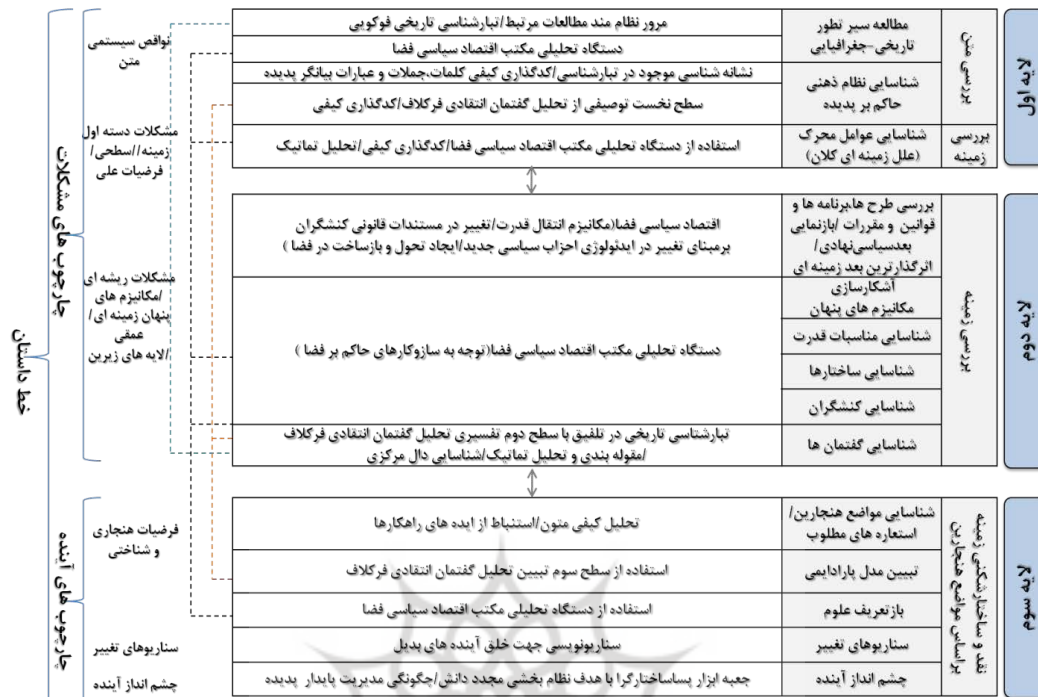
Chart 3- Methodological framework of the layers of the adjusted model