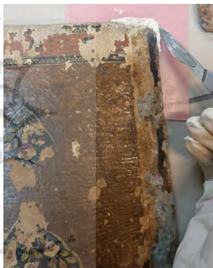
شکل ۷. بازسازی گوشه جلد با استفاده از بتونه آماده شده

جهت بوم‌سازی قسمت‌های کمبود جلد، ابتدا از ترکیب پلکستول و پودر مل به همراه رنگ اکریلیک سفید و سپس ترکیب مشابه بدون اکریلیک استفاده شد که پس از تست، هر دو نمونه دچار ترک خوردگی شدند. پس از آن از ترکیب چسب HV360 با آب مقطر و اضافه کردن تدریجی پودر مل (پودر مل صلایه شده) استفاده شد. اینکار تا زمانی انجام شد که بتونه به حالت عسلی درآید، پس از آن با کمک قلمو، روی نقاط کمبود به صورت لایه لایه استفاده شد. قبل از بستر سازی یک لایه پلکستول ۵ درصد به عنوان پرایمر بر روی تکیه گاه کشیده شد. بعد از خشک شدن بتونه، سطح کار با استفاده از کاغذ سمباده پرداخت شد تا سطحی کاملاً صاف و یکدست