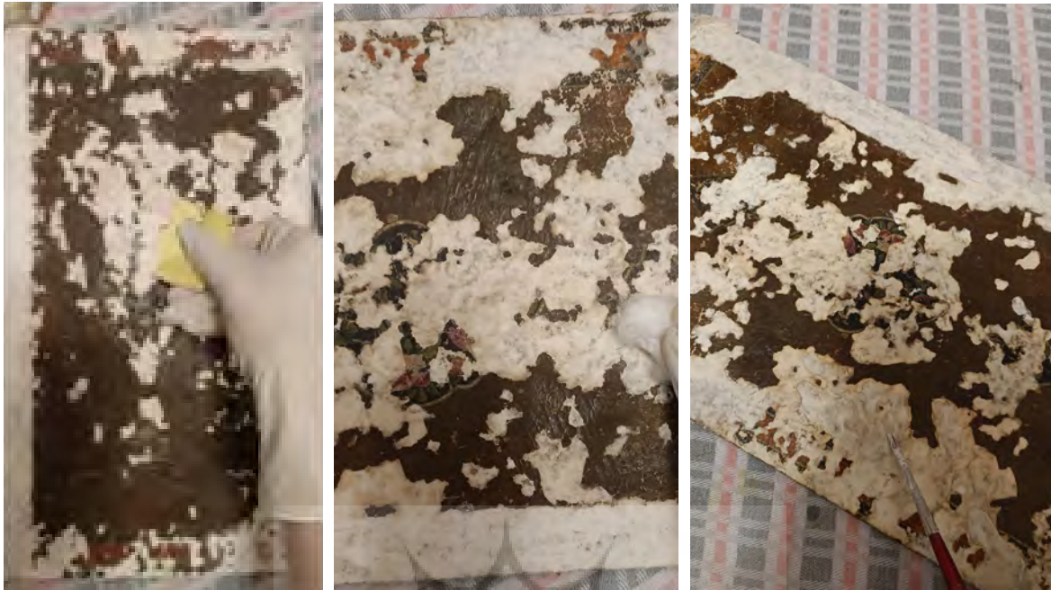
شکل ۸. بومسازی سطح اثر و سمباده کشی بخش‌های بتونه و بومسازی شده و ایجاد لایه پرایمر با استفاده از چسب HV360

حاصل شود. همچنین برای جلوگیری از نفوذ رنگ به داخل بستر، یک لایه چسب HV360 با غلظت ۳٪، بر روی سطح کار کشیده شد (شکل ۸).