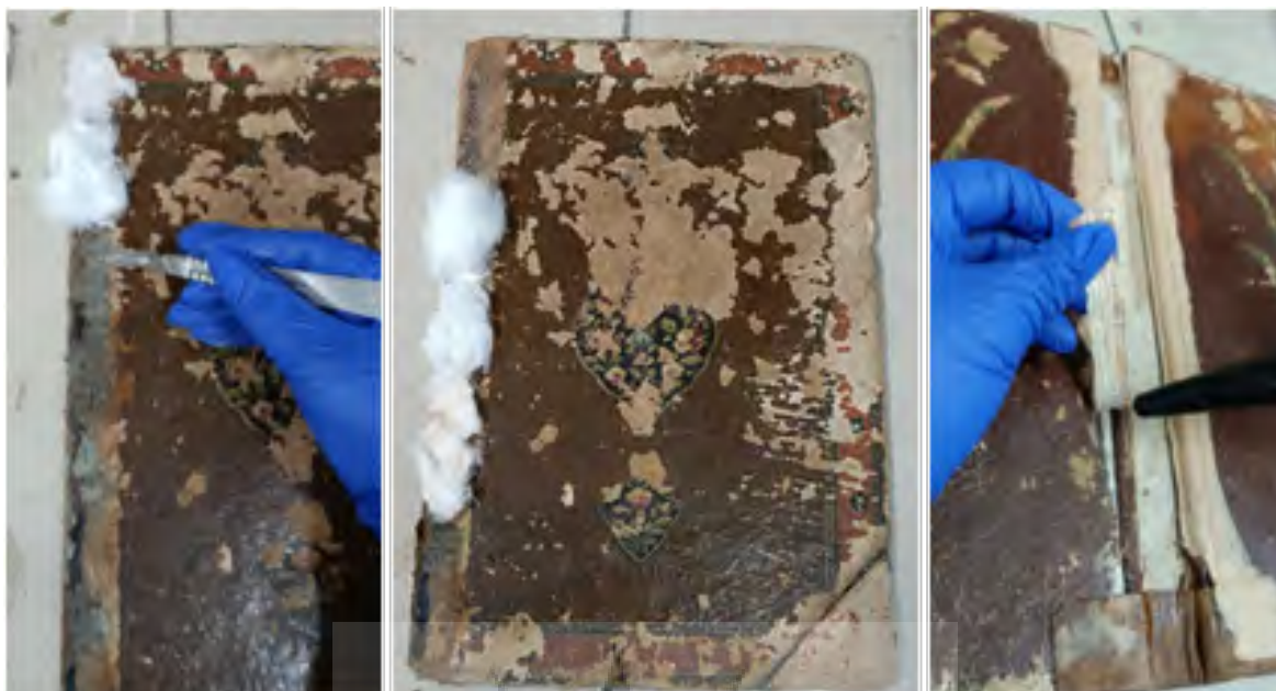
شکل ۳. جداسازی چرم ناحیه عطف جلد