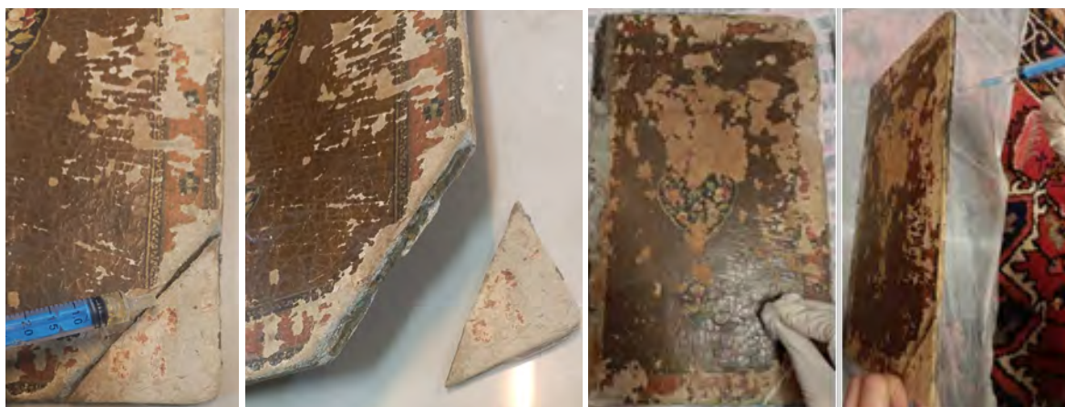
شکل ۶. وصالی گوشه جداشده جلد (دو شکل چپ)