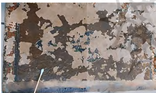
شکل ۴. پاکسازی سطح اثر با استفاده از ترباتین و اتانول

بر روی پنبه باقی بماند، سپس پنبه را به آرامی بر روی جلد کشیده و قسمت قابل توجهی از زردی و چرکی روی سطح برطرف گردید (شکل ۴). برای از بین بردن کامل زردی و چرکی روی جلد، مجدداً از ترکیب ترباتین و اتانول (۹۰:۱۰) استفاده شد.