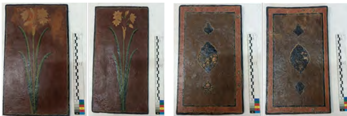
شکل ۱۰. تصاویر پشت و روی دو بخش جلد مورد بررسی پس از اتمام فرایند مرمت