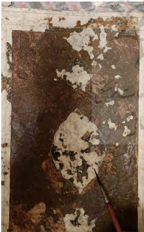
شکل ۹. موزون‌سازی رنگی

برای پوشش نهایی اثر، کل سطح کار با یک لایه پلی وینیل بوتیرال ۳ درصد پوشش دهی شد. اینکار جهت استحکام بخشی بیشتر لایه های رنگ نیز انجام گرفت. به علت در اختیار نبودن کتاب، ضخامت عطف آن نامشخص بود. از این رو به جهت اجتناب از آسیب‌های بعدی، ترجیح بر این شد که دو لت به صورت مجزا نگهداری شوند تا اندازه عطف مشخص شود (شکل ۱۰).