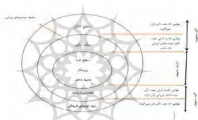
شکل ۱: مدل ارتباط بین عوامل تعیین‌کننده موفقیت فردی و ملی (دی‌بوسچر و همکاران، ۲۰۰۶)

سطح خرد: ورزشکاران فردی (کیفیت ژنتیکی) و محیط نزدیک آن‌ها (به‌عنوان مثال، والدین، دوستان و مربیان)؛ در سطح خرد، برخی از عوامل می‌توانند کنترل شوند (مانند تکنیک‌ها یا تاکتیک‌های آموزشی) و برخی نمی‌توانند کنترل شوند (مانند ژنتیک). این سه سطح در تعامل هستند و هیچ فاکتوری نمی‌تواند کاملاً از محیط‌های اجتماعی و فرهنگی درون کشور جدا شود. در واقع هم‌پوشانی بین سطح خرد و کلان وجود دارد (دی‌بوسچر و همکاران، ۲۰۰۶: ۱۸۶-۱۸۸).