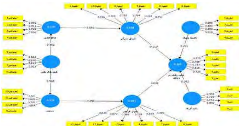
شکل ۲: مدل اندازه گیری