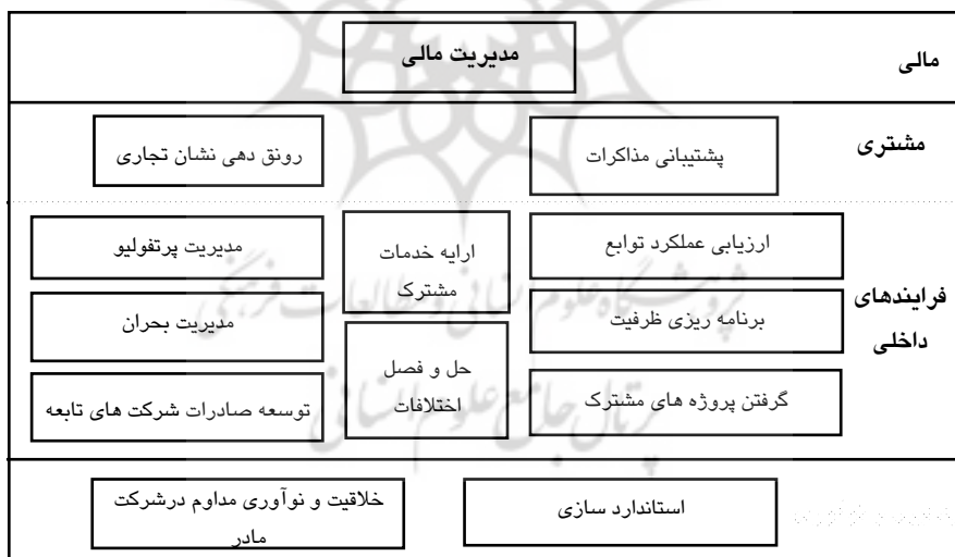
شکل ۳ طبقه بندی فرآیندهای شرکت مادر در چهارچوب ارزیابی متوازن بر اساس مطالعات موردی شرکت های مادر موفق

چهارچوب ارزیابی متوازن تقسیم بندی شده و چهارچوب اولیه مدل مفهومی این تحقیق را پایه ریزی کرده است. مدیریت مالی یک سازمان مادر بیان کننده وضعیت شرکت مادر از دیدگاه اعداد و ارقام می باشد و به دلیل نشان دادن نتایج ملموس استراتژیهای شرکت مادر، در دیدگاه مالی قرار گرفته است. پشتیبانی مذاکرات و رونق دهی نشان تجاری، بر فروش و وفاداری مشتریان تأثیرگذار است، لذا این فرآیندها در دیدگاه مشتری قرار گرفته اند. در مدیریت پرتفولیو، شرکت مادر، سبد محصولات خود را براساس استراتژیها تبیین و مدیریت می کنند. همچنین فرآیندهای حل و فصل اختلافات، ارزیابی عملکرد توابع، ارایه خدمات مشترک، برنامه ریزی ظرفیت، گرفتن پروژه های مشترک، مدیریت بحران، و توسعه صادرات شرکت های تابعه، همگی می توانند برای شرکتهای مادر ارزش متمایزی ایجاد کرده، در دیدگاه فرآیندهای داخلی سازمان قرار گیرند. در دیدگاه یادگیری و رشد، استاندارد سازی فرآیند و خلاقیت و نوآوری مداوم در سطح شرکت های مادر قرار گرفته اند که آنها را در پشتیبانی صحیح فرآیندهای ارزش زا کمک کنند.