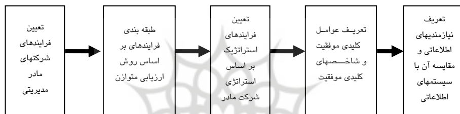
شکل ۲ مراحل انجام تحقیق برنامه ریزی استراتژیک سیستم های اطلاعاتی در شرکت های مادر

در این تحقیق از روش توصیفی- پیمایشی [۲۶] استفاده شده و همچنین از ۲ مرحله نظر سنجی تشکیل شده است. ۱ پرسشنامه اول به شناسایی فرآیندهای شرکتهای مادر مدیریتی می پردازد و پرسشنامه دوم به منظور رتبه بندی عوامل بحرانی موفقیت و شناسایی نیازمندیهای اطلاعاتی سازمان مورد استفاده قرار می‌گیرد. در هر دو پرسش نامه از طیف لیکرت استفاده شده است. مراحل مختلف انجام تحقیق در شکل ۲ مشخص شده است.