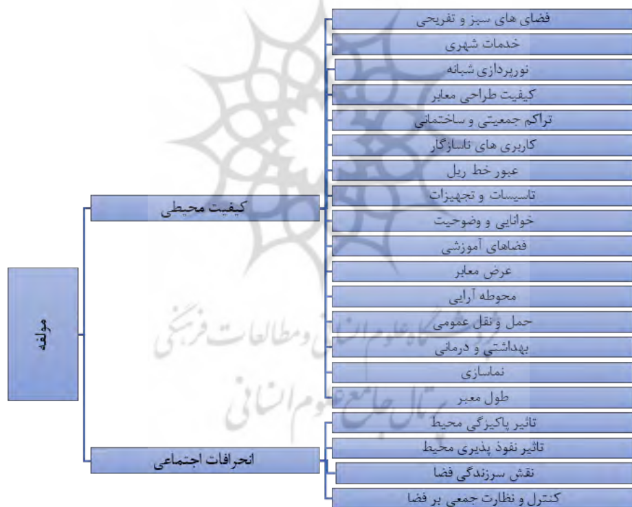
شکل ۱. مدل مفهومی پژوهش

در این پژوهش، برای بررسی ارتباط کیفیت محیط و انحرافات اجتماعی از روش مغالطه تصدیق تالی (Affirming the consequent) استفاده شده است. در تصدیق تالی، به خلاف منطق استدلالی که از مقدمه به نتیجه اشاره می‌شود،