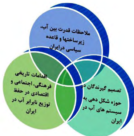
شکل ۵. چشم اندازهای رویکرد اکولوژی سیاسی آب درایران