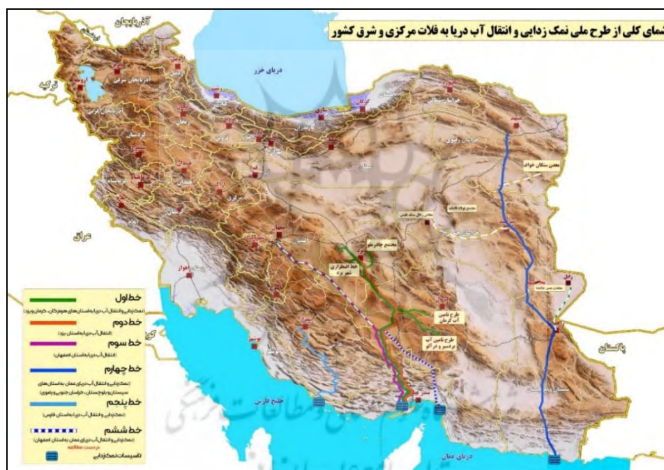
شکل ۴. منبع: (خبرگزاری اخبار آب: ۲۶ بهمن ۱۴۰۱ https://akhbarab.com/?p=10033 )

منبع: (خبرگزاری عصر ایران: ۱۳ اسفند ۱۴۰۱ https://www.asriran.com/003gq4 )