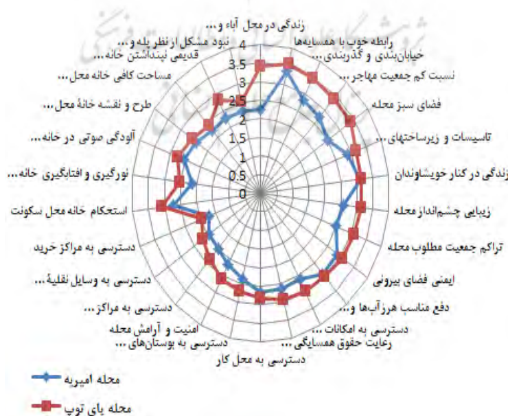
شکل ۲. نمودار راداری شاخص‌های رضایت از سکونت در دو محله مورد مطالعه

همان‌گونه که در نمودار شکل ۲ آشکار است، رضایتمندی سکونتگاهی در همه شاخص‌ها در محله پای توپ بالاتر از محله امیریه قرار دارند.