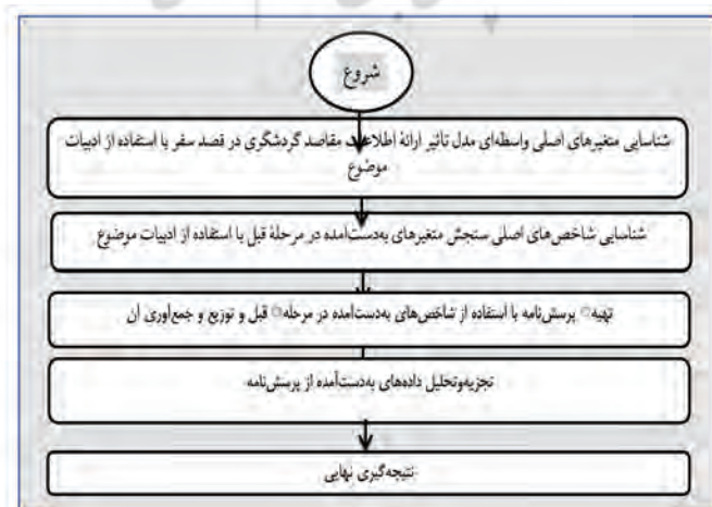
نمودار ۲: مراحل اجرایی تحقیق

شد. آن‌گاه، با استفاده مجدد از ادبیات موضوع، شاخص‌های سنجش متغیرها به دست آمد. در مرحله بعدی، با استفاده از این شاخص‌ها پرسش‌نامه تهیه و در جامعه آماری توزیع شد. در نهایت، با تجزیه و تحلیل داده‌های به دست آمده از پرسش‌نامه نتیجه‌گیری نهایی در خصوص تأثیر ارائه اطلاعات مقاصد گردشگری در قصد سفر در رسانه اجتماعی اینستاگرام انجام شد.