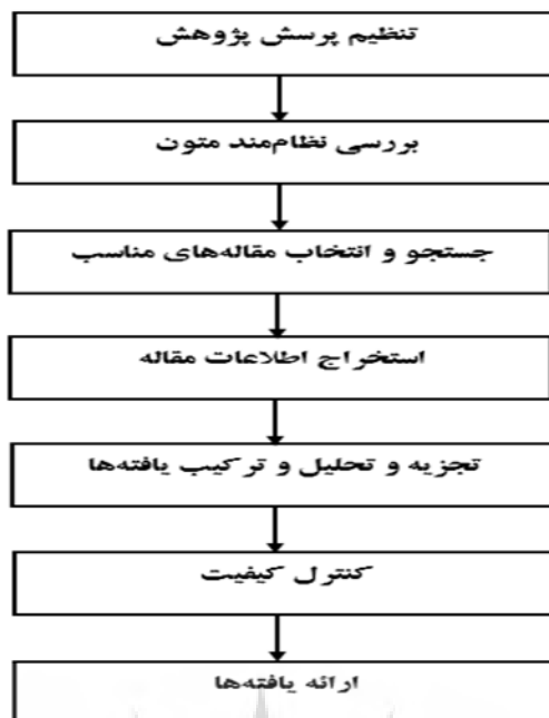
شکل ۱. مراحل هفت‌گانه فراترکیب (سندلوسکی و باروسو، ۲۰۰۳)