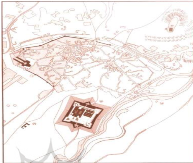
تصویر ۳- نقشه هوایی از اردبیل و محدوده نارین قلعه (شاه محمد اردبیلی، ۱۳۹۴: ۱۱۲).