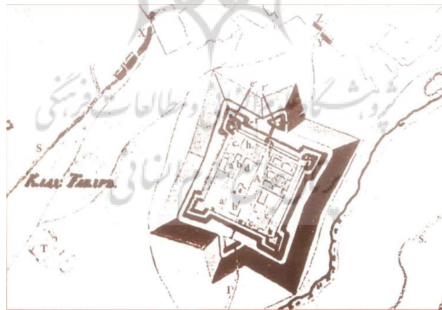
تصویر ۴- تصویری از پلان نارین قلعه اردبیل با جزئیات دقیقی از تقسیمات داخل قلعه (شاه محمد اردبیلی، ۱۳۹۴: ۱۵۵).