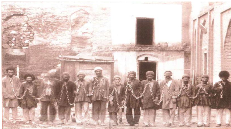
تصویر ۱۰ زندانیان نارین قلعه اردبیل (علی‌خان والی، بی‌تا: ۱۵۰)

قسمتی از این قلعه باز به‌عنوان مکان زندان استفاده می‌شد و گاه هواداران مشروطه و مخالفان حکومت نیز در آن زندانی و شکنجه می‌شدند (کسروی، ۱۳۷۸: ۲۴۱-۲۴۰؛ نظری، ۱۳۹۱: ۷۵).