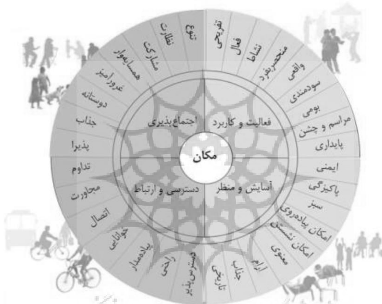
مدل مکان دیاگرام شکل ۱: