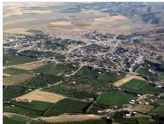
شکل (۳) منطقه ژئوتوریستی روستای راژان

زمان‌های گذشته می‌باشد. از نظر هیدرولوژی، حوزه مطالعاتی راژان یکی از سرشاخه‌های رودخانه باراندوز از زیرحوزه‌های دریاچه ارومیه است. به دلیل ایجاد سد چای در منطقه و به زیر آب رفتن چندین روستا. اهالی این روستاها در روستای راژان اسکان گزیدند به همین دلیل راژان دارای نفوس بیشتری نسبت به سایر روستاهای منطقه می‌باشد. این روستا در دهستان دشت قرار داشته است. شکل (۳)