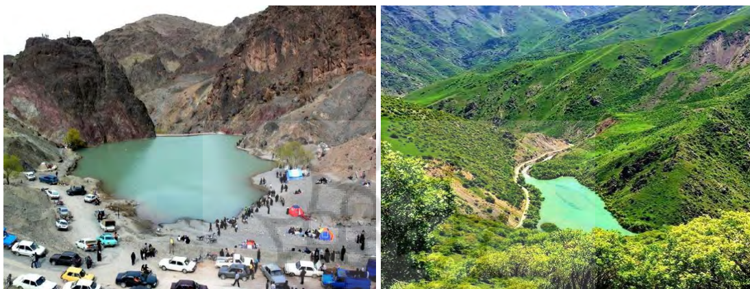
شکل (۴) منطقه ژئوتوریستی روستای مارمیشو

منطقه مارمیشو، در ۷۰ کیلومتری ارومیه در شمالغربی این منطقه در دره قرار دارد. موقعیت جغرافیایی آن ۳۴ تا ۳۷ درجه عرض شمالی و ۴۴ درجه طول شرقی واقع شده است. ارتفاع آن از سطح دریا ۳۵۰۰ متر و در میان دره‌ای با شیب ۳۰ تا ۶۰ درصد است. این منطقه بکر و سرسبز در دامنه‌ی کوه‌های مرزی ایران و ترکیه و در دره‌ی بانی قرار گرفته است. منطقه مارمیشو از جنوب به قتل سیتاو قایدوک، چال از شمال به کوه بایدوست از غرب به روستای مخروبه دری و از شرق به روستاهای بانی و پسان منتهی می‌شود. دریاچه مارمیشو نیز با وسعت حدود پنج هکتار در میان کوهستانهای مجاور مرز ایران و ترکیه قرار دارد. شکل (۴).