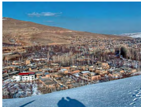
شکل (۲). منطقه ژئوتوریستی بند

تفرجگاه بند در یک منطقه کوهستانی قرار گرفته است و از همه‌جهت توسط کوه‌های مرتفع احاطه شده است. کوه‌ها و زمین‌های روستای بند به لطف بارش باران در فصل‌های مختلف سال، به رنگ سبز هستند و شاهد طبیعت بکر و خارق‌العاده‌ای در این منطقه هستیم. وجود باغ‌های بزرگ در قسمت‌های مختلف و درختان سر به فلک کشیده این باغ‌ها، باعث شده که این روستا از دور مانند یک جواهر سبز رنگ در دل کوه‌ها دیده شود. این روستا طبیعت بکر و فوق‌العاده‌ای دارد که در نوع خود بسیار کمیاب می‌باشد. از جاذبه‌های ژئوتوریستی این منطقه مناطق اطراف حوضه رودخانه و سرسبزی‌های چشمگیر است. رستوران‌های این منطقه از دیگر جاذبه‌های این روستا بشمار می‌آید