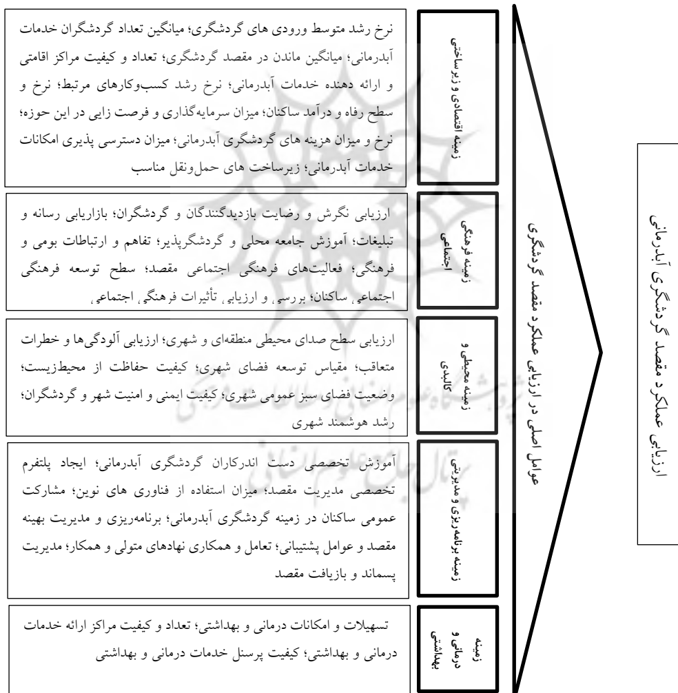
شکل ۲. الگوی ارزیابی عملکرد مقصد گردشگری آب‌درمانی

با عطف به مؤلفه‌ها و شاخص‌های جدول فوق ملاحظه می‌شود همه موارد برگرفته از شرایط و زمینه‌های پایه‌ای و اساسی شهر سرعین در حوزه گردشگری آب‌درمانی بوده و به‌عنوان عوامل اصلی در ارزیابی عملکرد این گردشگری در شهر سرعین می‌باشند. به‌منظور بررسی و تأیید موارد مذکور، نیاز است تا نظرات متخصصان و خبرگان نیز در این رابطه اقداماتی صورت پذیرد. از همین رو، در فاز دوم تحقیق، یعنی روش کمی پیمایش، هریک از موارد فوق در پرسش‌نامه‌ای محقق ساخته با طیف ۵ گانه لیکرت برای خبرگان ارسال و نظراتشان احصا شد.