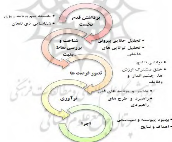
شکل ۲- چارچوب مدل سوآر

البته، تهدیدها و مشکلات نادیده گرفته نخواهد شد، به آن‌ها دوباره شکل داده خواهد شد و توسط ذره‌بینی از ممکنات دیده خواهند شد. شناسایی مجموعه‌هایی با عملکرد و هسته‌ی مثبت، چیزهای با ارزش و مفید و شبکه‌ها و توانی‌ها و تفکرات خلاق و در کل هر آنچه را که ما را به سمت پیشرفت می‌کشاند، به ما می‌شناساند. به طور خلاصه، استراتژی مثبت یاب SOAR افق تازه‌ای را فراروی دیدگاه‌های سنتی برنامه‌ریزی راهبردی می‌گشاید. این افق تازه با برجسته‌سازی قوت‌ها و فرصت‌ها و آرمان‌های یک مجموعه و درگیر کردن گروه‌های مختلفی از افراد دارای سهم در جامع همراه است (شکل ۲).