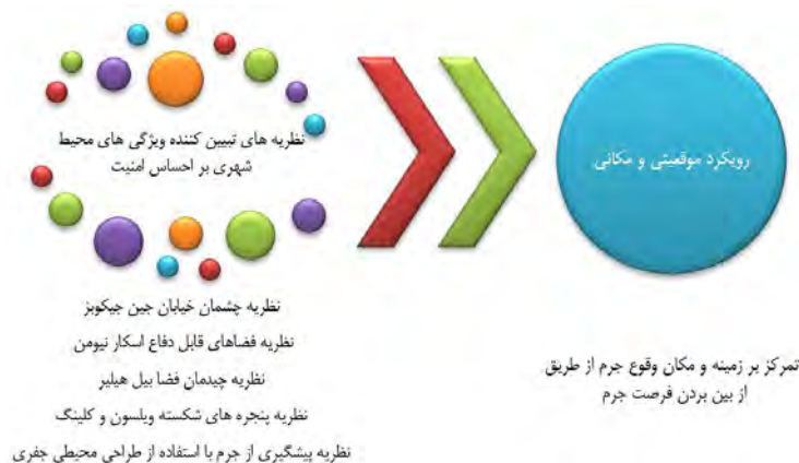
شکل ۱. چارچوب نظری تحقیق

برای نمونه در تحقیق ویژگی‌های محیطی تأثیرگذار بر احساس امنیت شهری، محقق می‌تواند هدف تحقیق خود را تبیین اهمیت و تأثیر ویژگی‌های محیطی در احساس امنیت شهری یا ناامنی و ترس تعریف کند. در این بخش همان‌طور که شکل (۱) نشان می‌دهد نظریه‌هایی چون چشمان خیابان ۵ ، جین جیکوبز ۶ ، فضاهای قابل دفاع ۷ اسکار نیومن ۸ ، چیدمان فضای ۹ بیل هیلیر ۱۰ ، پنجره‌های شکسته ۱۱ ویلسون و کلینگ ۱۲ و نظریه پیشگیری از جرم با استفاده از طراحی محیطی ۱۳ جفری ۱۴ مطرح شده‌اند.