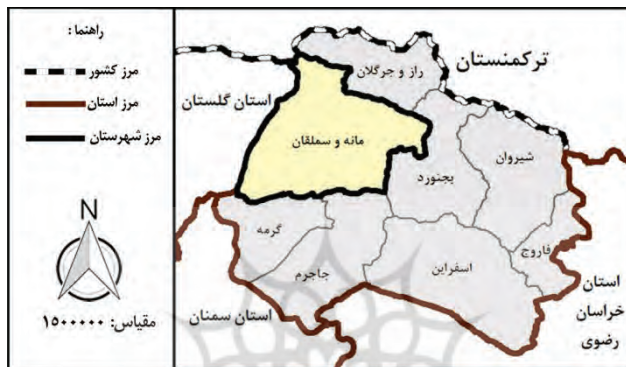
شکل شماره (۲): موقعیت قرارگیری شهرستان مانه و سملقان در منطقه

شده و با گردآوری بیش از ۱۳۰۰ نشانه در سطح ۱۲۶ نقطه روستایی شهرستان مانه و سملقان و مقایسه آنها با یکدیگر، در نهایت، ۲۴ مفهوم کلی تعیین شده است. گفتنی است در این پژوهش، به منظور تحلیل داده‌های گردآوری شده و شناسایی تأثیرگذارترین پیش‌ران‌های مؤثر بر پایداری معیشتی نقاط سکونت شهرستان، از نرم‌افزار میک‌مک ۱ بهره گرفته شده است. با استفاده از این نرم‌افزار می‌توان ضمن شناسایی پیش‌ران‌های کلیدی براساس میزان تأثیرگذاری و تأثیرپذیری (Abdullah al., 2021: 9) آن‌ها را در چهار دسته معیارهای وابسته، معیارهای مستقل، معیارهای خودمختار و معیارهای پیوند دسته‌بندی کرد (Singh & Misra, 2021:5125) در بخش روش‌شناسی و تحلیل میک‌مک در مجموع دو نوع پراکنش تعریف شده است که به نام سیستم‌های پایدار و ناپایدار معروف‌اند. در سیستم‌های پایدار پراکنش متغیرها به صورت L انگلیسی نشان داده شده است؛ یعنی برخی متغیرها دارای تأثیرگذاری بالا و برخی دارای تأثیرپذیری بالا هستند. در سیستم‌های پایدار مجموعاً سه دسته متغیر را مشاهده می‌کنیم: الف: متغیرهای بسیار تأثیرگذار بر سیستم (عوامل کلیدی)؛ ب: متغیرهای مستقل؛ ج: متغیرهای خروجی سیستم (متغیرهای نتیجه). اما در سیستم‌های ناپایدار وضعیت پیچیده‌تر است و متغیرها حول محور قطری صفحه پراکنده‌اند و در بیشتر مواقع از تأثیرگذاری و تأثیرپذیری حالت بینابینی را نشان می‌دهند که این امر ارزیابی و شناسایی عوامل و شاخص‌های کلیدی را