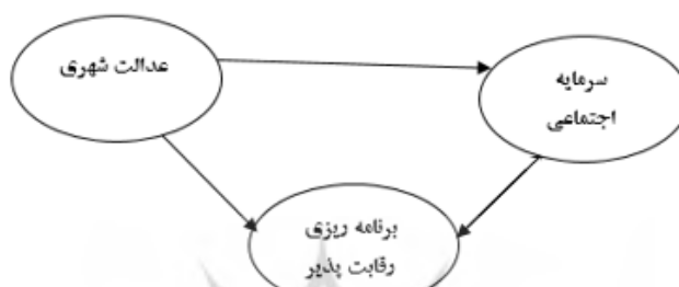
شکل ۱. الگوی مفهومی پژوهش

استفاده شد که برنامه ریزی رقابت پذیر شهری را در قالب ۵۶ گویه شامل مؤلفه های اقتصادی، اجتماعی و زیست محیطی مورد سنجش و ارزیابی قرار می دهد. پایایی این پرسشنامه بر اساس ضریب آلفای کرونباخ ۰/۹۱ بدست آمد. برای بررسی روایی کل مؤلفه های این پرسشنامه از روش تحلیل عاملی تأییدی استفاده شد که شاخص های برازش GFI=0/91 ، RMSEA=0/06 ، CFI=0/93 ، AGFI=0/90 نشانگر روایی مناسب این پرسشنامه جهت سنجش برنامه ریزی رقابت پذیر می باشد. جهت تجزیه و تحلیل داده ها از نرم افزار spss و Lisrel استفاده گردید.