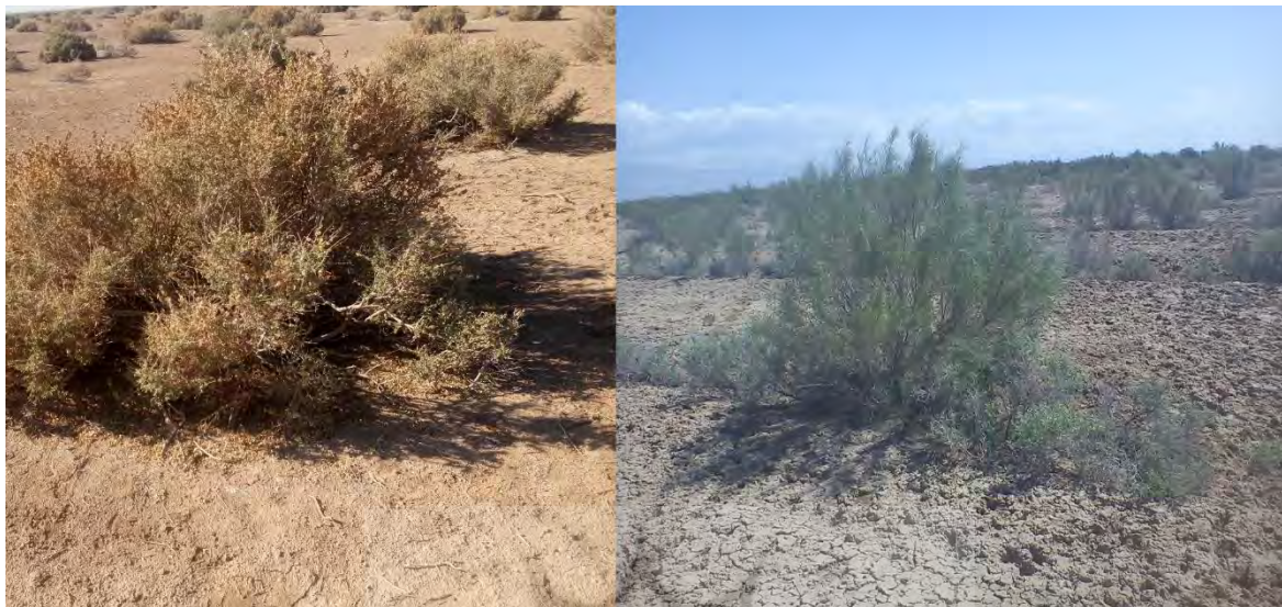
شکل ۲: گونه‌های کشت‌شده در منطقه‌ی مورد مطالعه

آتریپلکس ۲ و قرهداغ ۳ بوده و نحوه‌ی کاشت گونه‌ها بر روی یک ردیف و به فاصله‌ی ۸ متر از ردیف کناری کشت است. آرایش کشت بر روی هر ردیف به صورت دو بوته‌ی آتریپلکس، دو گلدان تاغ و دو بوته‌ی قرهداغ، به فواصل منظم چهارمتری است. تصاویری از گونه‌های کشت‌شده در منطقه در شکل ۲ نشان داده شده است.