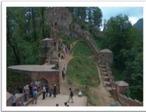
شکل ۵: نمایی از غار تاریخی فوشه