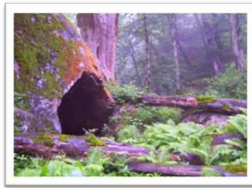
شکل ۴: نمایی از قلعه‌ی تاریخی رودخان