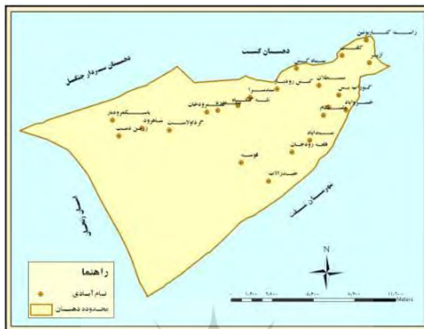
شکل ۲: موقعیت روستاهای مورد مطالعه دهستان گوراب‌پس در شهرستان فومن