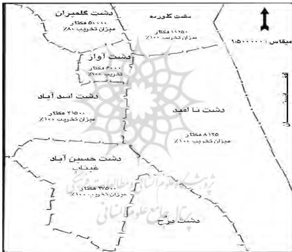
شکل شماره ۱ - نقشه میزان اراضی تخریب شده شرق استان خراسان جنوبی توسط پناهندگان افغانی منبع: فال سلیمان، ۱۳۶۷: ۳۰

گرفته و به منظور مدیریت مشارکتی احیا مراتع، فعالیت‌های متنوعی در خصوص توسعه اقتصادی و اجتماعی جوامع محلی با تکیه بر اصل مدیریت مشارکت جویانه و افزایش ظرفیت این جوامع انجام گردیده است. مدل مدیریت مشارکتی بر پایه اصول بسیج جوامع محلی، به گونه‌ای طراحی شده که مردم محلی بتوانند قابلیت‌های خود را بایکدیگر در راستای بهبود وضعیت اقتصادی و اجتماعی و مدیریت پایدار مراتع مهار نمایند. (The bureau of carbon sequestration project -2004:25) مردم محلی به مشارکت در همه‌ی مراحل اجرایی پروژه تشویق شدند به نحوی که با واگذاری مسئولیت این برنامه‌ریزی محلی قادر باشند مناطق تخریب شده را احیا نموده و بر حفاظت از آن مدیریت نمایند و مسئولیت بیشتری را برای تامین معیشت خود داشته باشند. علاوه بر شیوه‌های مشارکتی معمول به‌عنوان یک مکانیسم علمی و عملی و موفق، همگام با ساختار اجتماعی منطقه به منظور ظرفیت‌سازی و بسیج جوامع محلی، تشکیل گروه‌های توسعه روستایی و صندوق‌های خرداعتباری باهدف تسهیل مشارکت روستاییان در فعالیت‌های مالی و اجرایی مورد توجه قرار گرفت.