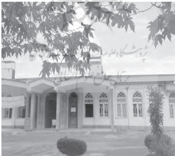
تصویر شماره ۷. امامزاده ابراهیم، آمل

همچنین امامزاده‌هایی با کارکرد آرامگاهی در شهر و روستاهای مازندران وجود دارد که هم موقوفات دارد و هم زمین آن وقف است، مانند امامزاده ابراهیم آمل (آقاعبدالله، [۹۲۶ هـ.ق]: آرشیو ۳۳۱). ۱