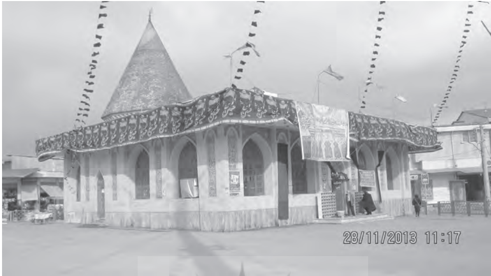
تصویر شماره ۱. امامزاده یحیی، ساری

«قبر را سنگ کردن» سنت دیگری در خصوص قبور مردگان است. بدین شرح که بازماندگان نوعی از سنگ و نوشته بر آن را انتخاب می‌کنند و یک روز قبل از چهل‌م فرد درگذشته، قبر را سنگ می‌کنند. اگر پس از چهل روز این کار انجام نشود، در باور مردم مازندران یعنی به فرد درگذشته احترام نگذاشته‌اند. البته در برخی از روستاهای مازندران زودتر از این موعد نیز قبر را سنگ می‌کنند.