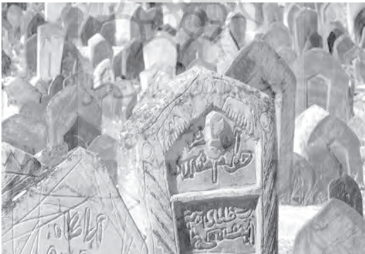
تصویر شماره ۳. گورستان سفیدچاه، قدیمی‌ترین گورستان اسلامی (سلطانی مجاوری، ۱۳۹۹)