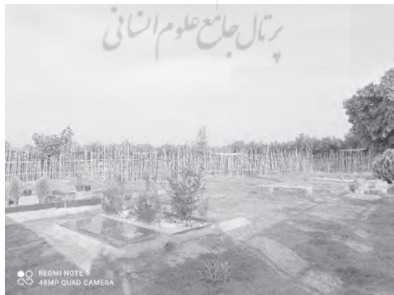
تصویر شماره ۵. گورستان وقفی شماره ۲، کاله شمالی در بهنمیر، بابلسر