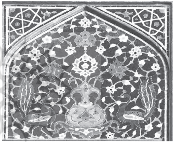
نقش دو طاووس در دو طرف کوزه آب حیات درخت زندگی، مسجد امام اصفهان، دوره شاه عباس صفوی

این نقش از جمله نقوشی است که در تزئینات مساجد و اماکن مذهبی دوره صفویه حضوری چشمگیر دارد؛ چنانکه در تزئینات ایوان ورودی مسجد امام اصفهان، تزئینات سردر ایوان ورودی، امامزاده هارونیه و مدرسه چهارباغ دیده میشود. این نقش همچنین در کاشیکاریهای کلیسای وانک، نمای بیرونی کاخ هشت بهشت و سردر بعضی بناها در خیابان هارونیه اصفهان دیده میشود. علل حضور این نقش بر پیشانی ایوان ورودی مساجد، مدارس دینی و امامزاده‌ها، در عصر صفویه بویژه در اصفهان، این بوده که علاوه بر اینکه طاووس را یک مرغ بهشتی میدانستند، شاید بعنوان دربان و راهنمای مردم به مسجد هم لحاظ میکردند (همان: ۲۶).