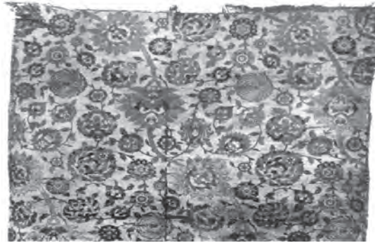
پارچه ابریشمی با استفاده از یک شکل تلطیف شده از درخت نخل در دوران صفوی