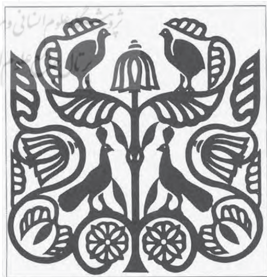
لوح گچی تیسفون (دوره ساسانی) موزه متروپلیتن نیویورک

نقش طاووس جایگاه مهمی را در هنر ایران به خود اختصاص داده است. این نقش اغلب با مفاهیم مذهبی همراه میباشد. نقش طاووس نه تنها بعنوان نقشی نمادین در آثار هنری دوره اسلامی بکار گرفته شده، بلکه این پرنده در دوران باستان، در آیین زرتشت بعنوان مرغی مقدس مورد توجه بوده است. در دوران باستان معتقد بودند طاووس بدلیل نوشیدن آب حیات، عمر جاودانه یافته است. در بسیاری از آثار دوره ساسانی، نقش طاووس در تزئینات و یا در دو طرف درخت زندگی قرار گرفته است؛ بطور مثال نقش طاووس در نقش برجسته‌های طاق‌بستان، پارچه‌ها و یا در لوح‌های گچی تیسفون دوره ساسانی دیده میشود (خزایی، ۱۳۸۶: ۲۵).