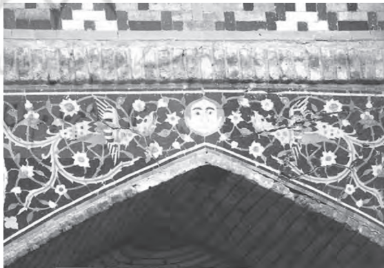
نقش سیمرغ، سردر یکی از ایوانهای مجموعه گنجعلی خان، کرمان، سده یازدهم هجری

سیمرغ در منسوجات دوران صفوی نیز نقش شده است و تقریباً با اوصافی که از آن، در منابع ادبی و اساطیری رفته، مطابقت دارد. پرنده‌یی بزرگ با بالها و دمه‌های متعدد و بلند و پیچان و دهان منقارگونه از مشخصات آن است و به فیزیک واقعی پرندگان شباهت بیشتری دارد.