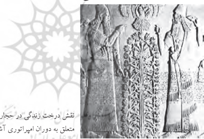
نقش درخت زندگی در حجاری متعلق به دوران امپراتوری آشور

تصویر درخت زندگی بشدت از سنتهای ساسانی پیروی میکرد که در آن درخت زندگی در مرکز قرار داشت و توسط دو یا چند موجود متقارن محافظت میشد. هنرمندان نساجی نیز در دوران صفوی از اسطوره‌های ساسانیان الهام گرفتند. ترسیم درخت زندگی در باغ و طرحهای محراب، یادآور تصاویری از آسمان و زندگی ابدی پس از مرگ است. از آنجایی که باور به خدا و زندگی پس از مرگ، در تمدن و فرهنگ ایرانی ریشه دارد، در دوره صفوی، موضوع اصلی در طراحی منسوجات بوده است. (Kamizi, Hassani, Jalali, Jafari, 2014: 431) درخت زندگی گاهی در قالیچه‌های محرابی نیز دیده میشود. در این قالیچه‌ها نماد درخت زندگی، گاهی بطور متقارن، توسط پرندگان احاطه شده است که نشان‌دهنده وحدت و زندگی پس از مرگ است. محراب، دروازه بهشت را نشان میدهد و همچنین یک پناهگاه امن است که مردم را به زندگی پس از مرگ متصل میکند؛ بنابراین بسیار شبیه به طرح اصلی درخت زندگی است (Ibid: 424).