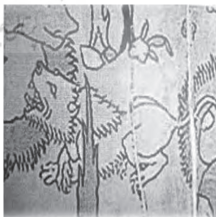
نقش شیر در آجرهای لعابدار دوران صفوی نقش شیر در نقاشیهای دوران صفوی (همانجا)