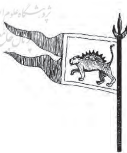
۱۰۲۰ تا ۱۰۲۸ هـ.ق درفش با نقش شیر و خورشید شاهنامه شمس‌الدین کاشانی؛ درفش با تصویر شیر و خورشید