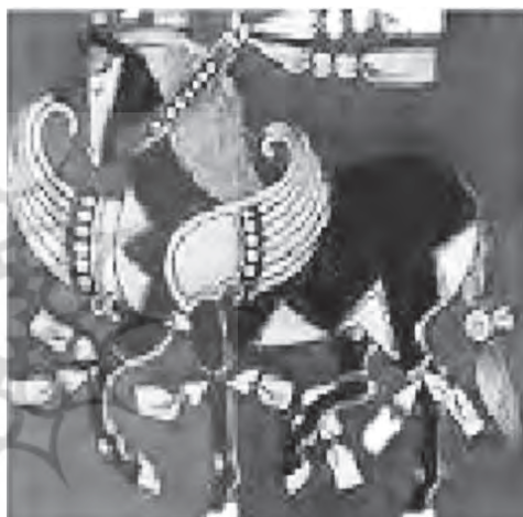
نقش اسب در دوران هخامنشی (احمدیان و رشه، ۱۳۹۴: ۱۱) و نقش اسب در دوران صفوی (همانجا)