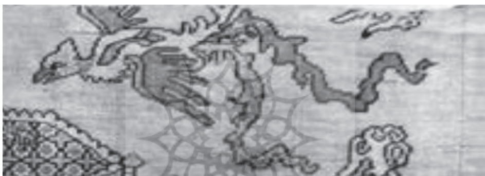
نقش سیمرغ در منسوجات دوره صفوی