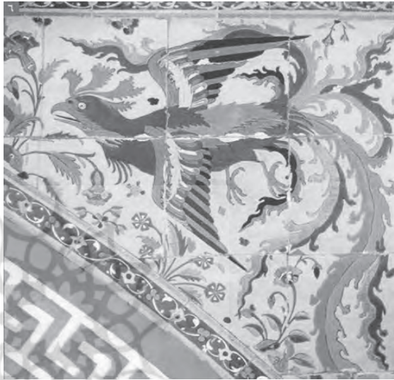
نقش سیمرغ، تزئینات نمای جنوبی قصر هشت بهشت، سده یازدهم هجری

مطلق در عرفان اسلامی است. در دوره صفوی این نقش به نسبت دوره‌های قبل و همچنین در مقایسه با نقش طاووس کمتر استفاده شده است. یکی از زیباترین نقشهای سیمرغ در اصفهان، در کاشیکاریهای نمای بیرونی کاخ هشت بهشت میباشد. نقش سیمرغ در جدال با اژدها، در تزئینات دیوارنگاری سقف قصر صفویه در شهر نایین (خانه پیرنیا) از زیباترین نقوش دوره صفویه است.