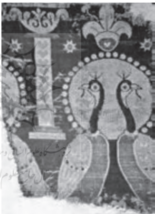
نقش طاووس در منسوجات ساسانی نقش طاووس در منسوجات دوره صفوی