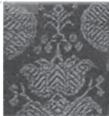
گل نیلوفر در حجاریهای تخت جمشید گل نیلوفر در منسوجات دوران صفوی