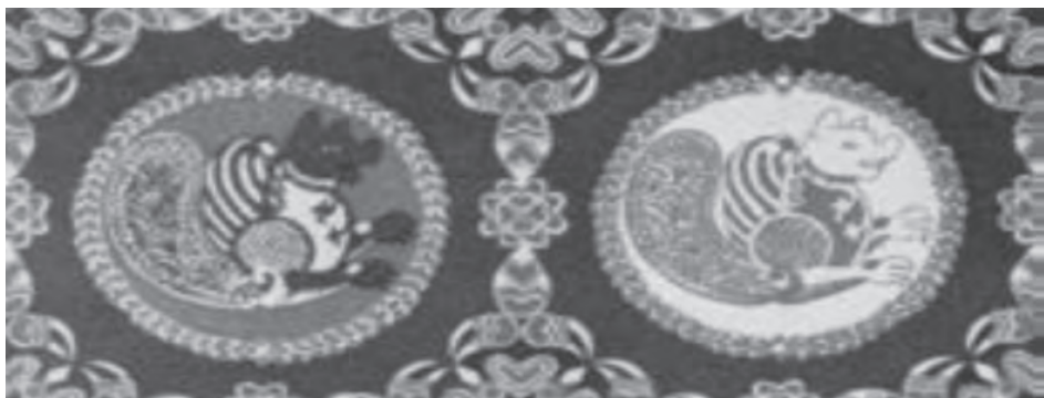
نقش سیمرغ در منسوجات ساسانی