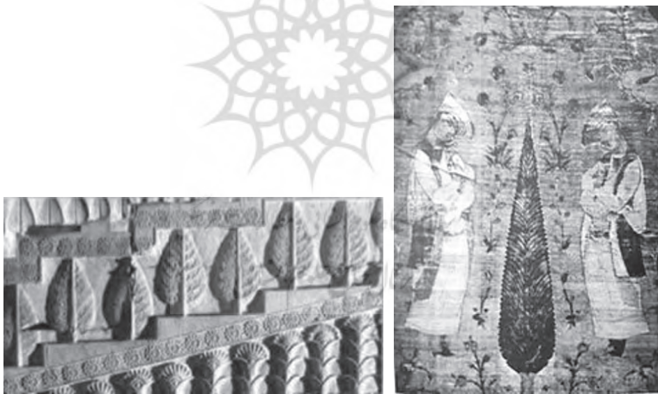
نقش درخت سرو در حجاریهای تخت جمشید پارچه مخملی طراحی شده به سبک رضا عباسی

سرآغاز باور به مقدس بودن سرو، به تمدنهای عیلامی و آشوری بازمیگردد که سرو نماد خوشی و خرمی و یگانه درخت مقدس بود. اما در دوره پارتی و ساسانی، سرو دیگر یگانه درخت مقدس نبود و رفته‌رفته جای خود را به درختان دیگر داد و تقریباً پیکره‌اش محو شد. در دوران اسلامی سرو از ریشه‌های باستانی جدا شده و به نگاره‌ی زینتی مبدل شد و از ماهیت مذهبی خود دور گشت که در این مرحله، بصورت بسیار ساده درآمد (امینی، ۱۳۸۰: ۸۱). در طول دوره صفوی، درخت سرو به یک نشانه قدرت تبدیل شد و همچنین در جواهرات تاج پادشاهان حضور یافت. در یک پارچه مخملی که به سبک رضا عباسی بافته شده، دو مرد جوان نشان داده میشوند که در یک لباس معمولی صفوی قرار دارند و بطور متقارن دو طرف درخت سرو ایستاده‌اند که همانند سنت ساسانیان، ممکن است این مردان جوان، بعنوان نگهبانان درخت باشند. این پارچه در حال حاضر در مؤسسه هنر شیکاگو نگهداری میشود (Ibid: 424).