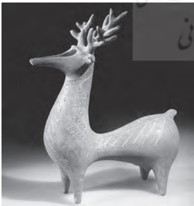
(تصویر ۷). ریتون بشکل گوزن، مکشوفه از شمال ایران؛ محل نگهداری: موزه ملی ایران