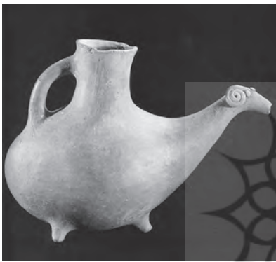
(تصویر ۶). ریتون، بشکل قوچ، مکشوفه از منطقه گرمی؛ تاریخ احتمالی، سده دوم تا اول قبل از میلاد؛ محل نگهداری: موزه ملی ایران

با ارتفاع سی سانتیمتر، منتهی به سر بز کوهی با ریش و شاخهای بلند است. پاهای حیوان خم شده و زانو زده است. دهانه خروج مایع در سینه حیوان قرار گرفته و کل حجم مایع از آن به آرامی خارج میشده است. این ریتون بسیار باریک و ظریف از دو تکه تشکیل شده و سر برجسته آن بعداً بدان افزوده شده است. تعادل بین سر ریتون و ظرف شاخی شکل بسیار خوب ایجاد شده است. دهان و سوراخهای بینی ریتون کنده کاری شده اند. پاها نازک و لوله‌یی شکل همراه با خمیدگی به سمت بیرون است. این ریتون در موزه ملی ایران نگهداری میشود (زایبل، ۱۳۸۰: ۲۹۱).