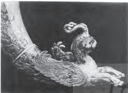
(تصویر ۴). ریتون منتهی به سر شیر شاخدار بالدار؛ محل نگهداری: موزه تاریخ عشق آباد

ریتون منتهی به بدنه شیر شاخدار و بالدار (تصویر ۴)، در طرف دیگر و زیر لبه این ریتون، زنی با دو لوحه در دست و زن دیگر با عطردان مرمری و زن سومی با یک جعبه، احتمالاً حاوی جواهرات، نشان داده شده است. در ادامه این قسمت مردی بر عصایی تکیه داده است.