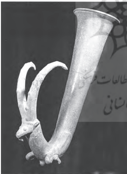
(تصویر ۵). ریتون شاخی - شکل منتهی به سر بز، مکشوفه از تپه کوهان (ده کیلومتری فیروزکوه)؛ محل نگهداری: موزه ملی ایران

دارند. برخی از آنها از قلمرو ایران امروزی بدست آمده و برخی دیگر متعلق به نواحی بین‌النهرین است. محل کشف و فرم این ریتونها عبارتند از: ریتون شاخی شکل از تپه کوهان، ریتونی به شکل بدن حیوان از ری، ریتونی منتهی به سر اسب از مسجد سلیمان، ریتونی بشکل قوچ و ریتون دیگری بشکل آفورا از گرمی، کوزه ریتون از تل شاملو، کوزه ریتون از قومس، سفال خاکستری با تزئینات شاخی شکل از یاریم تپه، ریتون شاخی شکل منتهی به سر اسب از «دوراوپس» ۱ ، کوزه ریتون از نیپور، کوزه ریتون از سلوکیه، کوزه ریتون از اشدود، کوزه ریتون از تل بلا، کوزه ریتون از تل دیجبران، کوزه ریتون از بگرام و ریتونی مخروطی متصل به پشت اسفنگس از تاکسیلا ۲ بدست آمده است. دو نمونه از این ریتونها از جنس فلز و بقیه از جنس سفال هستند. از تنوع و پراکندگی گروه اخیر میتوان نتیجه گرفت که ساخت و تولید این ریتونها ریشه در فرهنگ و سنتهای برجای مانده از دولت هخامنشی و قبل از آن دارد و بر خلاف ریتونهای نسا، تأثیرات و تأثرات مستقیم دولت اشکانی (و فرهنگ یونانی) در بوجود آمدن آنها، نقش قابل ملاحظه‌یی نداشته است.