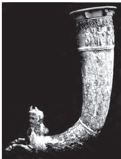
(تصویر ۲). ریتون شاخی شکل، منتهی به سر اسب شاخدار (مکشوفه از نسا)؛ محل نگهداری: موزه آرمیتاژ