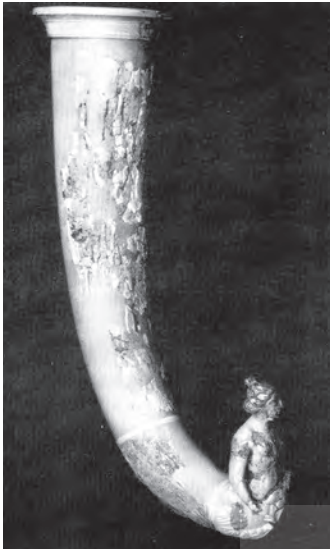
(تصویر ۱). ریتون شاخی شکل، منتهی به بدن انسان (مکشوفه از نسا) محل نگهداری: موزه آرمیتاژ

۱۹۴۸ م. در یکی از اتاقهای این مجموعه، موسوم به «اتاق مربع»، چهل ریتون شاخی شکل از جنس عاج بدست آمد. اتاق مربع، انبار اختصاصی آرامگاههای پادشاهان اشکانی بوده است. بنظر میرسد، اینجا همان محلی است که طبق مشاهدات ایزدور خاراکسی در نسا، مدفن بزرگان دین یا آرامگاه اجداد اشکانیان بوده است. تصور میشود، ریتونهای بدست آمده از این اتاق، هدایا و نذوراتی است که به آرامگاه اجداد پارتیان اهدا شده و شاید از آنها در مراسمی خاص (مربوط به آیین بزرگداشت نام و یاد اجداد و در گذشتگان اشکانی) استفاده میشده است (ماسون، ۱۳۸۳: ۱۷). بزرگی و سنگینی این ریتونها گمانه‌زنی استفاده آنها در آیینی خاص را تقویت میکند. شکل کلی این ریتونها عبارت است از ظرفی که در انتها با انحنا شاخی شکل به بدن حیوان، انسان یا یک موجود خیالی منتهی میشود و در بدنه ظرف و لبه آن تزئیناتی بکار رفته است.