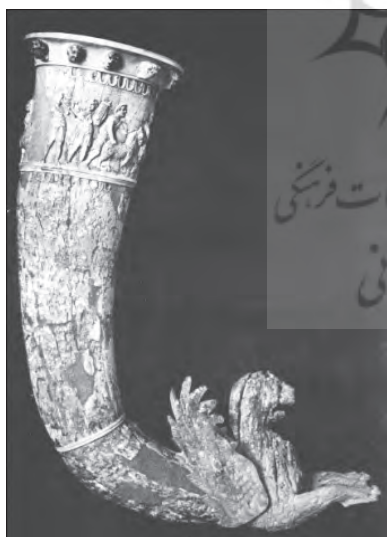
(تصویر ۳). ریتون شاخی شکل، منتهی به سر شیر شاخدار و بالدار که شاخهای آن شکسته است (مکشوفه از نسا)؛ محل نگهداری: موزه آرمیتاژ

ریتون شاخی شکل، منتهی به سر اسب شاخدار (تصویر ۲) که محل خروج مایع در میان سینۀ حیوان قرار دارد. ارتفاع ظرف ۵۵ سانتیمتر، قطر دهانۀ آن چهارده سانتیمتر و گنجایش آن یک لیتر است. این ریتون در موزه آرمیتاژ نگهداری میشود. پاهای اسب، بطرف جلو کشیده شده و نیم تنۀ حیوان نشسته را به نمایش میگذارد. حفاصل بین نیم تنۀ اسب و قسمت انحنایی جام، با برگهای کنگر تزئین شده است. قسمتی از لبۀ ریتون از بین رفته است. در قسمت زیر لبۀ ظرف، مجلسی به تصویر درآمده است که در آن خدای زئوس با نیم تنۀ برهنه با عصایی در دست چپ و گریزی در دست راست در کنار هرمس و زنی که با یک شئل و توری خود را پوشانده، ایستاده است. زن انگشت سبابه را بطرف بینی برده (مانند علامت سکوت) و به همراه خدای دیگری که احتمالاً دیوزینوس است، در مراسم جشنی شرکت کرده‌اند.