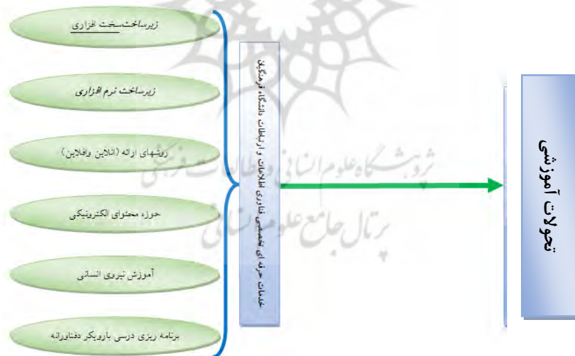
شکل 1- مدل مفهومی تحقیق (برگرفته از پیشینه‌ی نظری و تجربی)

با توجه به تحولات فناوری اطلاعات و ارتباطات در نظام آموزشی، محقق بر آن شد تا عنوان «بررسی ارائه‌ی خدمات حرفه‌ای و تخصصی فناوری اطلاعات و ارتباطات دانشگاه فرهنگیان بر تحولات نظام آموزشی» در دانشگاه فرهنگیان استان گلستان را بررسی کند و مدل مفهومی زیر جهت پاسخ به فرضیه‌های پژوهش طراحی گردیده است: