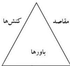
شکل ۱: جنبه‌های متعامل از مفاهیم تدریس (پرات، ۱۹۹۷)

هستند که از نظر پنهان بوده و برای فهمیدن تصور هرکسی از تدریس، تعیین‌کننده است. این تعاملی جمعی از کنش‌ها، مقاصد و باورهاست که هر مفهوم را تعریف می‌کند و تمیز می‌دهد. کنش‌ها بدون همراهی با مقاصد و شمول باورها، برای تفسیر و تراوش، بدون فرصتی برای اشتباه کردن، دشوار است" (پرات، ۱۹۹۷، ۲۵). این پژوهشگر علاقه‌مند به تدریس دانشگاهی، هر ۵ مفهوم کیفی از تدریس را در گروهی سه‌تایی مستقل و پویا از کنش‌ها ۱ ، مقاصد ۲ و باورها ۳ تلفیق کرده که در شکل ۱ آمده است: