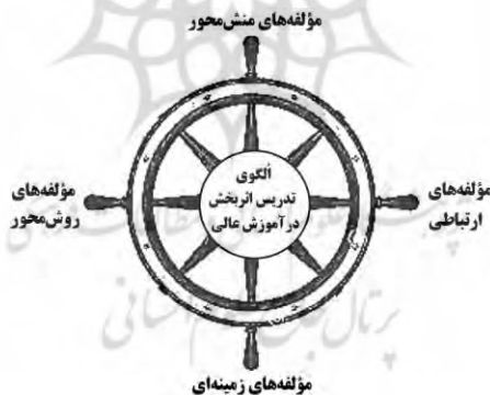
شکل ۴: الگوی فراترکیب برای تدریس اثربخش در آموزش عالی

الگوهای مفهومی و چارچوب‌های نظری می‌تواند به فهم بهتر تدریس اثربخش کمک کند. لذا، می‌توان با فراترکیب پیشینه نظری و پژوهشی، مؤلفه‌ها و عامل‌های موجود در ابزار و یا یافته‌های پژوهشی را در زیرمجموعه چهار مقوله کلی طبقه‌بندی و تلفیق کرد. در نتیجه برای اثربخش‌سازی تدریس در دانشگاه‌ها، مدرسان باید به‌مثابه‌سکان‌داران آموزش بر مبنای مسئولیت‌سنتی خود، زمینه‌های تدریس را در نظر بگیرند، به‌اندازه کافی در آموزش‌های دانشگاهی ارتباطات مناسب برقرار کنند، به‌اندازه کافی در تسهیل آموزش‌ها و ارزشیابی‌ها، حرفه‌ای عمل کنند و همواره در مسیر تدریس خود، خصوصیات رفتاری و اخلاقی شایسته را در محیط آموزشی به‌کارگیرند. بنابراین، جهت پاسخگویی به سؤالات پژوهشی و در تکمیل پاسخ سؤال دوم، داده‌های مشتمل بر مضمون‌های اصلی موجود بر اساس خلاصه نتایج، یافته‌ها یا ابزارهای مورداستفاده در پژوهش‌های مرجع به‌عنوان الگوی فراترکیب تدریس اثربخش در آموزش عالی در شکل ۴ ارائه شده است: