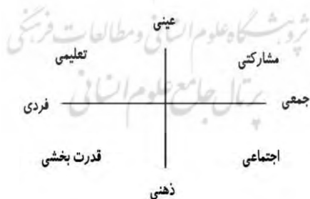
شکل ۳: پیوستار دوطرفه تدریس (کارنل، ۲۰۰۷).

۴) پیوستار دوطرفه تدریس: یکی از الگوهای نسبتاً جدید ارائه‌شده در ارتباط با طیف‌ها و جنبه‌های مختلف آموزش است. این پیوستار، الگویی است که توسط کارنل ۱ (۲۰۰۷) تبیین و تدوین شده است. در حقیقت این الگو برای سنجش نقاط دارای هم‌خوانی و تضاد در مفاهیم روشن تدریس و زندگی‌های مدرسان به‌ندرت در پیشینه گزارش شده است. الگوی ارائه‌شده در این زمینه دارای دو محور عمودی و افقی است که از تدریس در رابطه با عینی و ذهنی بودن و یا فردی و جمعی بودن، چهار رویکرد شامل تعلیمی ۲ ، مشارکتی ۳ ، قدرت بخش ۴ و اجتماعی ۵ را مطرح کرده که در پیوستار شکل ۳ آمده است.