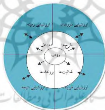
تصویر ۱: ارزش‌های اساسی و بنیادی مدل سیپ

- جهت‌گیری قوی برای ارائه خدمت: از این طریق ارزشیابان در تشخیص ذی نفعان حقیقی و نیازهای آنان حمایت می‌شوند. در نتیجه، با استفاده از این الگو اطلاعات صحیحی در جهت تصمیمات برنامه تعیین شده و به بهبود ارائه خدمات منجر می‌شود. -دخیل کردن سهامدارن یا ذی‌نفعان و خدمت به آنان ۱ : مفهوم سهامداران یکی از اساسی‌ترین مفاهیم این الگو است. سهامداران کسانی هستند که قرار است از یافته‌های ارزشیابی مطلع شوند. از آن جایی که معمولاً صاحبان قدرت کسانی هستند که اطلاعات را در اختیار دارند، الگو سیپ بر اهمیت آگاهی همه سهامداران برنامه تاکید می‌کند. -جهت‌گیری بهبودگرایانه ۲ : یکی از مهم‌ترین اصول سیپ توجه به این نکته است که هدف از ارزشیابی نه تایید کردن برنامه، بلکه بهبود آن است. از سویی این رویکرد با متوقف کردن فعالیت‌هایی که مورد نیاز سازمان نیست، منابع و زمان را در راستای فعالیت‌های ارزشمند جهت‌دهی می‌کند. -جهت‌گیری عینیت‌گرایانه ۳ : در این الگو تبعیض، تورش و علائق شخصی در نتیجه‌گیری‌ها حذف می‌گردد. به این ترتیب، اطلاعات صحیح‌تری در اختیار برنامه‌ریزان و تصمیم‌گیرندگان قرار می‌گیرد. -استانداردها و فرا ارزشیابی: این الگو از ارزشیابان می‌خواهد که به صورت حرفه‌ای با استانداردهای ارزشیابی رو به رو شده و از هر دو روش تکوینی و پایانی استفاده نمایند. از فرا ارزشیابی در جهت تصحیح کمبودهای مسیر ارزشیابی استفاده می‌شود (استافیل بیم، ۲۰۰۷: ۳۳۴-۳۳۰)