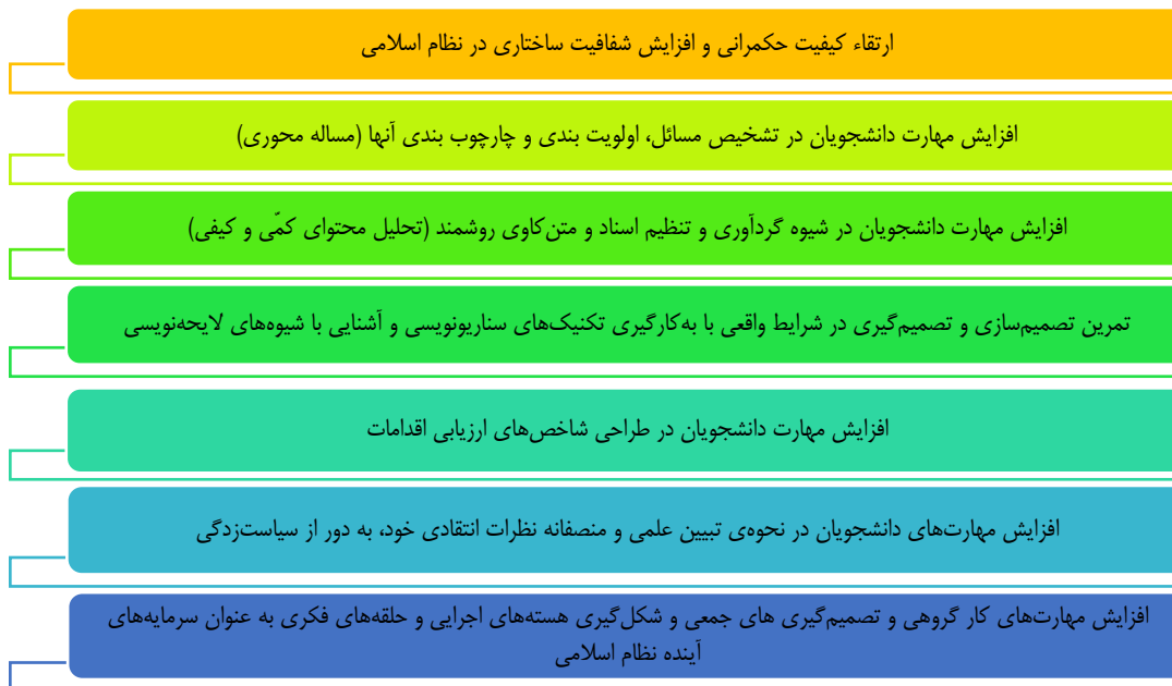
شکل 3- ساختار و کارکردهای دولت دانشجویی

بر پایه همین مدل مفهومی، در گام نخست برای تشکیل دولت دانشجویی، بر اساس شیوه نامه ای از اعضای مناسب برای پایش هر وزارتخانه یا سازمان انتخاب می شوند و هر یک مشابه ساختاری که به آن اشاره شد به همراه تیمی مرکب از کارشناسان و مشاوران متخصص، مسئولیت مطالعه و نظارت بر عملکرد یک دستگاه حکمرانی یا وزارتخانه را برای دوره ای مشخصی به عهده می گیرند.