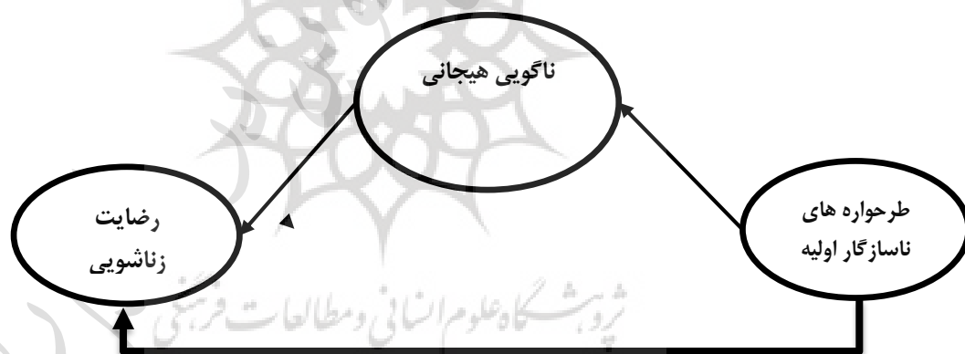
نمودار ۱. مدل مفروض طرحواره های ناسازگار اولیه به رضایت زناشویی نقش میانجیگری ناگویی

بنابراین، مروری بر پیشینه پژوهشی رضایت زناشویی نشان می‌دهد که ناگویی هیجانی نقش میانجی‌گری را در رابطه‌ی بین طرحواره‌های ناسازگار اولیه و رضایت زناشویی دارد (قاسمی، ۱۳۸۹؛ استیلز، ۲۰۰۴. یوسفی، عابدین، تیرگری و فتح‌آبادی، ۱۳۸۹؛ واگنر و لی ۱ ، ۲۰۰۸؛ وان هیلو، دسمیت، مگانک و بوگرت ۲ ، ۲۰۰۷؛ ریزو، تیوت، استین و یانگ، ۲۰۰۷). از طرفی، چنین فرض می‌شود که طرحواره‌های ناسازگار اولیه با تأثیری که بر ناگویی هیجانی فرد دارد، می‌تواند به‌طور غیرمستقیم بر رضایت زناشویی فرهنگیان متأهل مؤثر واقع شود، فرهنگیان متأهل چون قشر مهمی در هستند که اغلب در کنار شغل، نقش مادری نیز دارند از همین رو توجه به موضوعات روانی این قشر می‌تواند گامی در جهت حل یکی از مشکلات آنان باشد؛ اما از آنجایی که تا به حال هیچ پژوهشی به بررسی اثر مستقیم و غیرمستقیم (میانجی‌گری) طرحواره‌های ناسازگار اولیه و رضایت زناشویی در قالب یک مدل علی در نمونه‌ای از فرهنگیان متأهل نپرداخته است؛ در نتیجه، توجه به این روابط و استفاده از روش مدل‌یابی علی برای مطالعه این روابط، می‌تواند مضامین مهمی درباره آگاهی از سازوکار تأثیرگذاری طرحواره‌های ناسازگار اولیه و رضایت زناشویی داشته باشد. بنابراین، مسئله اساسی پژوهش حاضر، ابتدا، بررسی رابطه مستقیم طرحواره‌های ناسازگار اولیه و رضایت زناشویی و ناگویی هیجانی با رضایت زناشویی در چهارچوب یک مدل ساختاری و سپس، آزمون نقش میانجی‌گری ناگویی هیجانی در مدل مفروض است (نمودار ۱). (قاسمی، ۱۳۸۹؛ استیلز، ۲۰۰۴. یوسفی، عابدین، تیرگری و فتح‌آبادی، ۱۳۸۹).