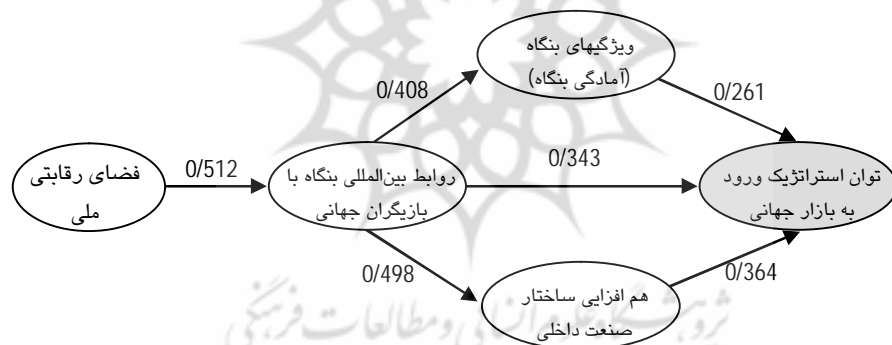
شکل 2 مدل پرونداد تحقیق

بنابراین می توان استنتاج کرد که سیاستگذاری برای بهبود توان رقابتی شرکتهای خودروسازی داخلی باید با اولویت بخشیدن به اصلاح و بهینه سازی: (1) روابط بین المللی شرکتهای خودروساز؛ (2) فضای رقابتی ملی کشور؛ (3) ساختار صنعت داخلی؛ (4) فضای درونی بنگاه بترتیبی که در جدول 6 مشاهده می شود، مورد توجه قرار گیرد. (د) نتایج آزمون مدلسازی معادلات ساختاری در خصوص آزمون کلی مدل پرونداد تحقیق (شکل 2) در جدول 7 ارائه شده است.