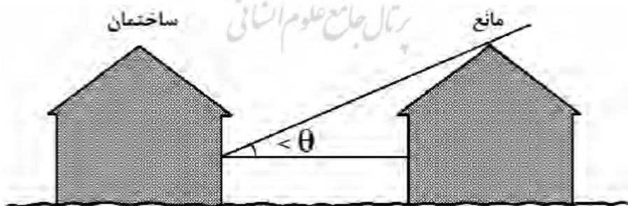
شکل ۲. نحوه محاسبه زاویه رویت مانع مقابل نورگیر (منبع: مبحث نوزدهم مقررات ملی ساختمان، ۱۳۸۹)

منبع: مبحث نوزدهم مقررات ملی ساختمان، ۱۳۸۹