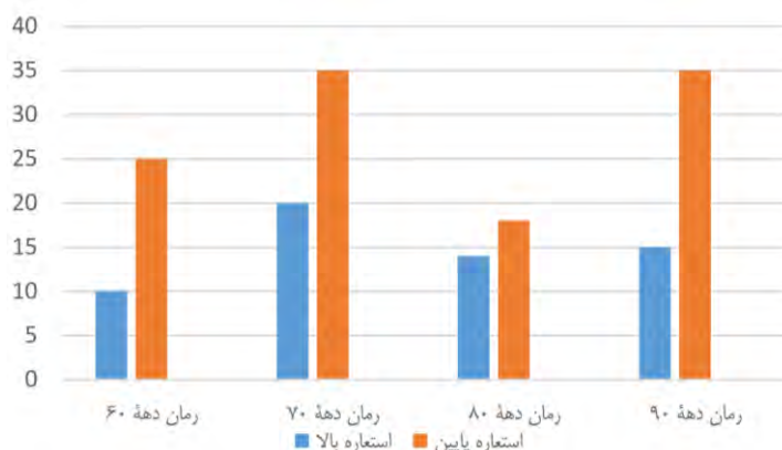
نمودار (۱). بسامد استعاره‌ها در چهار رمان

همان‌گونه که در نمودار (۲) مشاهده می‌شود در دو رمان نویسندگان زن چراغ‌ها را من خاموش می‌کنم از زویا پیرزاد و پاییز فصل آخر سال است از نسیم مرعشی کاربرد استعاره‌های پایین ۶۵ درصد است و استعاره‌های بالا ۳۵ درصد است.