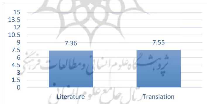
Figure 2 : La moyenne des personnes au post-test de qualité de la traduction avec le groupe