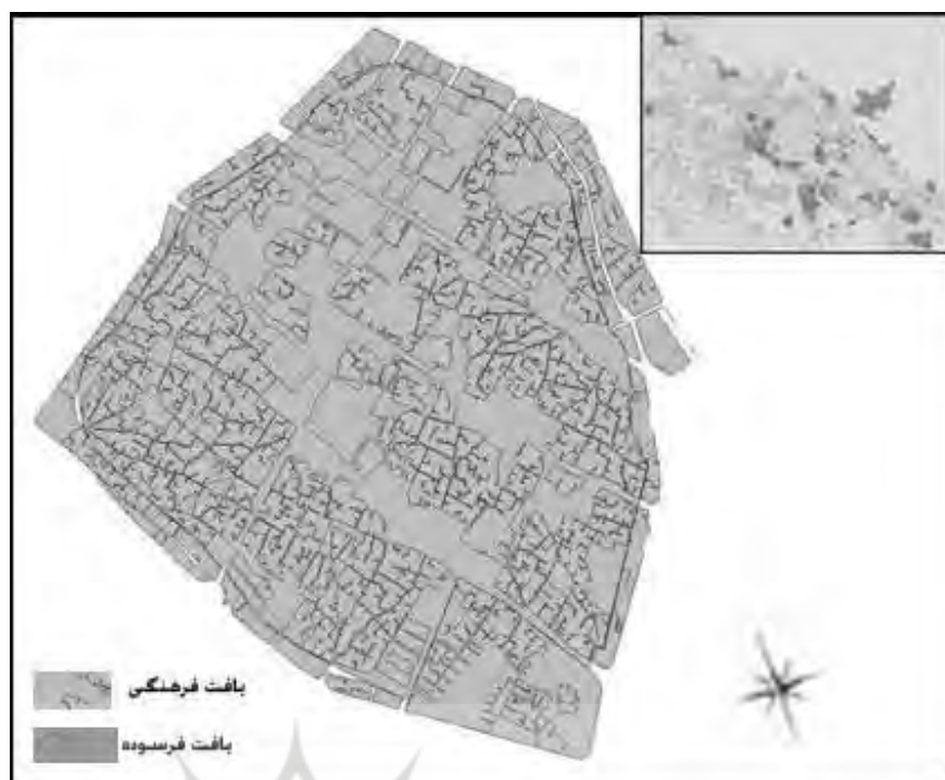
نقشه ۱. موقعیت بافت تاریخی و فرهنگی شهر شیراز؛ ماخذ: شهرداری شیراز.

عوامل محیطی مطابق با نمودار ۱ است که تاثیر آن بر متغیر وابسته «میزان تمایل مشارکت در بهسازی و نوسازی بافت» مورد بررسی قرار گرفته است. در این تحقیق از نرم افزار SPSS جهت ثبت اطلاعات و تجزیه و تحلیل آن استفاده گردید. وسعت منطقه تاریخی و فرهنگی شهر شیراز و تعداد زیاد خانه و تنوع در ساکنین و صاحب خانه، میزان همکاری آنها در جمع آوری اطلاعات از محدودیت های این تحقیق می باشد. در طراحی بعضی از سئوالات از طیف پنج گانه لیکرت استفاده شد. با توجه به محله بندی بودن منطقه تاریخی و فرهنگی شهر شیراز، جهت تعیین محله های نمونه، از روش نمونه گیری خوشه ای دو مرحله ای استفاده گردید. منطقه تاریخی و فرهنگی شهر شیراز به ۱۰ محله تقسیم شد و از هر محله تعدادی نمونه از خانه هایی که حاضر به پرکردن پرسشنامه بودند به صورت نمونه گیری غیر احتمالی انتخاب گردید. لازم به ذکر است معیار محله بندی پنج رقم اول کدپستی در نظر گرفته شد. پرکردن پرسشنامه در بازه زمانی تیرماه ۱۳۹۱ تا آبان ماه همان سال به صورت مقطعی صورت گرفت. در این پژوهش برای گردآوری داده ها از ابزار پرسشنامه محقق