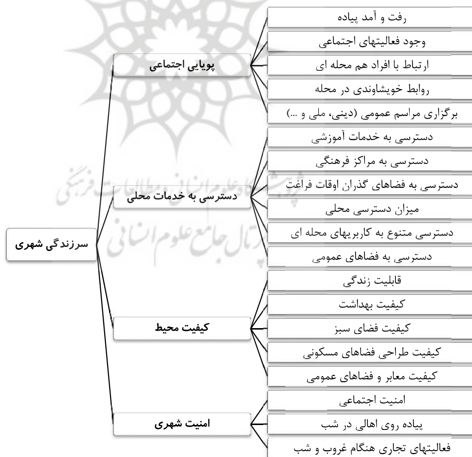
نمودار ۱. مدل تحلیلی تحقیق؛ ماخذ: نگارندگان.

در این پژوهش با تعریف سرزندگی به مفهوم «تنوع فعالیت‌ها و استمرار جریان زندگی در محیط مسکونی» توجه به مسائل کیفی حائز اهمیت بیشتری نسبت به کمیت می‌باشد بنابراین برای خلق محله سرزنده می‌بایست در عین حفظ شروط خاص یک محله اعم از پیاده مدار بودن و حضور عناصر شاخص، فضاهایی عمومی و همگانی در محله وجود داشته و تعاملات اجتماعی در آن تقویت گردد. به عبارتی شرط تحقق سرزندگی در محله، حضور در آن و برقراری ارتباطات اجتماعی و ایجاد نوعی حس مشارکت در امور شهر تلقی نموده است. در این میان نقش امنیت شهری را نیز نمی‌توان از نظر دور انداخت. از طرفی تامین شرایط مناسب زیستی و کاهش آلودگی‌های محیطی نیز شاید در درازمدت اما بسیار تاثیرگذار بوده و باید در برنامه‌ریزی‌ها