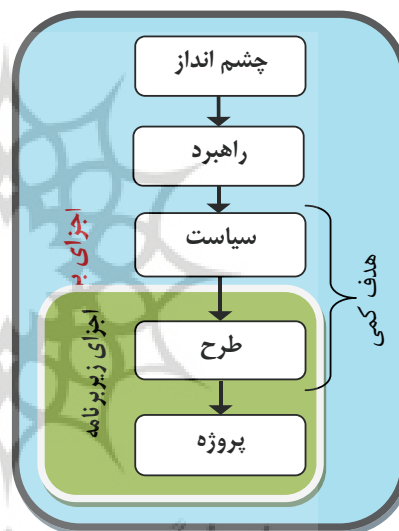
نمودار ۱. ارتباط همپایه اجزای برنامه؛ ماخذ: نگارندگان

«برنامه»: عبارت است از مجموعه‌ای از راهکارها و ساز و کارهای معین برای تحقق چشم‌انداز و راهبردهای تعیین شده توسط مراجع فرادست در بازه زمانی معین و بودجه مشخص. در این نظام نامه، منظور از برنامه، «برنامه میان مدت شهرداری تهران» است. ممکن است سایر معاونت‌ها و واحدهای شهرداری، برنامه‌های بخشی مربوط به خود داشته باشند؛ مانند «برنامه حمل و نقل و ترافیک شهر تهران»، «برنامه توسعه فضاهای فرهنگی شهر تهران» یا «برنامه مدیریت پسماندها در شهر تهران» ۲ .