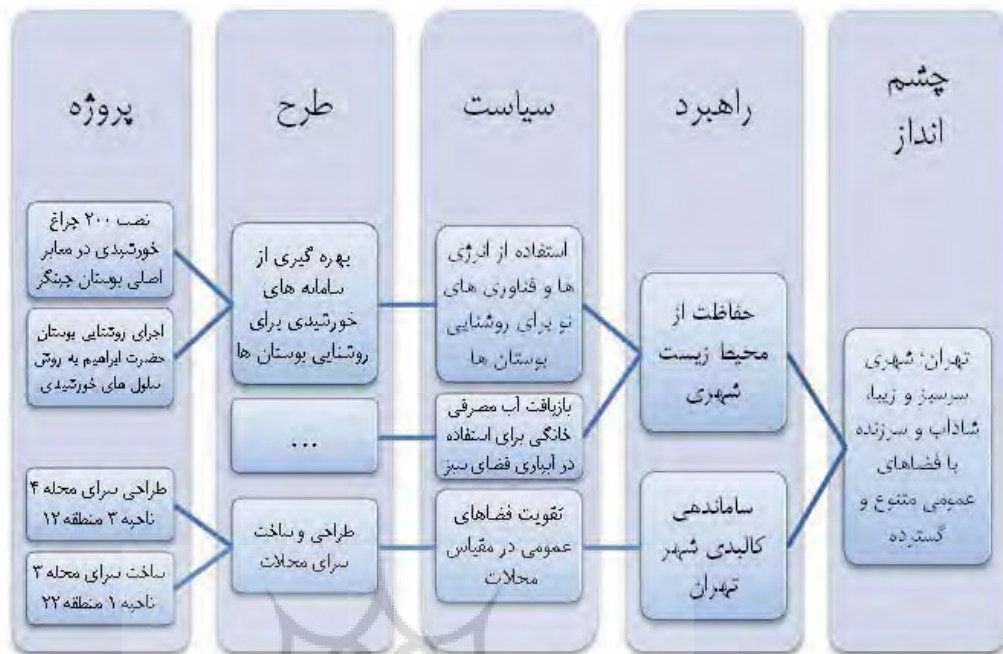
نمودار ۳. نمودار درختی نمونه برای اجزای برنامه

شماره ۵ منعکس گردیده است. همچنین در تدوین برنامه به منظور استانداردسازی اخذ اطلاعات از همه بخش‌های شهرداری و پرهیز از پراکنده کاری و تسهیل مرحله جمع بندی فرم‌هایی با عناوین ذیل تکمیل خواهد شد که روند تدوین برنامه را در بخش‌های مختلف شهرداری میسر خواهد ساخت: