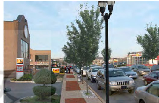
تصویر ۷. (بعد از اجرا) نمونه زیباسازی معبر در شهر گرین هیل آمریکا، قبل از اجرا؛ ماخذ: سازمان زیباسازی شهر تهران و جهاد دانشگاهی، ۱۳۹۱.

بهبود کفسازی، خالی کردن پیاده رو از ماشین، کاشت گونه های گیاهی و بهسازی زیرساختها و کفسازی های فضاهای شهری مورد توجه قرار گرفته است.