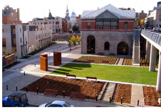
تصویر ۱۱. (بعد از اجرا) نمونه زیباسازی معابر در محله ساوت همپتون کانادا، بعد از اجرا؛ ماخذ: سازمان زیباسازی شهر تهران و جهاد دانشگاهی، ۱۳۹۱.

شهری که خصوصاً در جهان امروز به سبب تغییر شیوه های زندگی و ظهور نیازهای جدید بیش از گذشته پرداختن به این مساله لازم به نظر می رسد. چنانچه شهر را در رویکردی انسان شناختی معلول زیست انسانها در محدوده جغرافیایی مشخصی بدانیم آنچه سبب هویت یافتن این محدوده می گردد انسان و مسائل مربوط به آن چون فرهنگ و ویژگی های فرهنگی و اعتقادی آن است، بنابراین زیبایی و تعاریفی که از زیبایی در فضاهای شهری ارائه می شود تحت تاثیر فرهنگ ها و مدل های فرهنگی حاکم در هر شهر قرار می گیرد که بر این اساس مفهوم زیبایی و تعبیر و تعاریفی که از آن می شود تغییر پذیر و نسبی خواهند بود اما در این میان عواملی وجود دارند که به