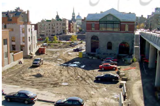
تصویر ۱۰. (قبل از اجرا) نمونه زیباسازی معابر در محله ساوت همپتون کانادا، قبل از اجرا؛ ماخذ: سازمان زیباسازی شهر تهران و جهاد دانشگاهی، ۱۳۹۱.