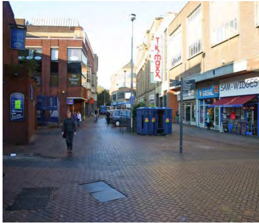
تصویر ۸. (قبل از اجرا) نمونه زیباسازی معابر در شهر دربی انگلستان، قبل از اجرا