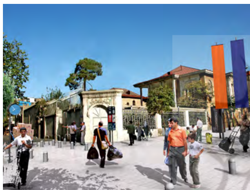
تصویر ۱۳. (بعد از طراحی) نمونه زیباسازی معابر در خیابان آصف تهران، بعد از طراحی؛ ماخذ: سازمان زیباسازی شهر تهران و جهاد دانشگاهی، ۱۳۹۱.

شهری که خصوصاً در جهان امروز به سبب تغییر شیوه های زندگی و ظهور نیازهای جدید بیش از گذشته پرداختن به این مساله لازم به نظر می رسد. چنانچه شهر را در رویکردی انسان شناختی معلول زیست انسانها در محدوده جغرافیایی مشخصی بدانیم آنچه سبب هویت یافتن این محدوده می گردد انسان و مسائل مربوط به آن چون فرهنگ و ویژگی های فرهنگی و اعتقادی آن است، بنابراین زیبایی و تعاریفی که از زیبایی در فضاهای شهری ارائه می شود تحت تاثیر فرهنگ ها و مدل های فرهنگی حاکم در هر شهر قرار می گیرد که بر این اساس مفهوم زیبایی و تعبیر و تعاریفی که از آن می شود تغییر پذیر و نسبی خواهند بود اما در این میان عواملی وجود دارند که به