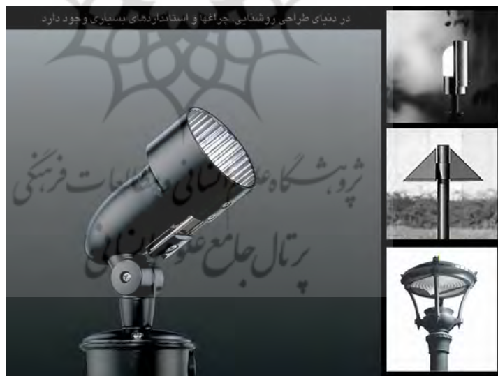
تصویر ۲. بهره گیری از تکنولوژیهای نوین نورپردازی در زیباسازی شهری؛ ماخذ: سازمان زیباسازی شهر تهران و جهاد دانشگاهی، ۱۳۹۱.

معروف بومی و اقلیمی و تاریخی معماری گردید که به مثابه انحراف از نخبه گرایی، و آوانگاردیسم بشمار می رفت. در نهایت پست مدرنیسم را می توان بر