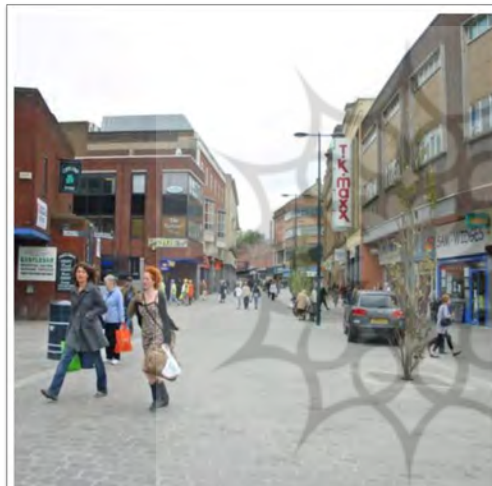
تصویر ۹. (بعد از اجرا) نمونه زیباسازی معابر در شهر دربی انگلستان، بعد از اجرا؛ ماخذ: سازمان زیباسازی شهر تهران و جهاد دانشگاهی، ۱۳۹۱.