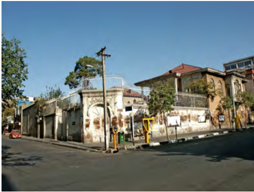
تصویر ۱۲. (قبل از طراحی) نمونه زیباسازی معابر در خیابان آصف تهران، قبل از طراحی؛ ماخذ: سازمان زیباسازی شهر تهران و جهاد دانشگاهی، ۱۳۹۱.