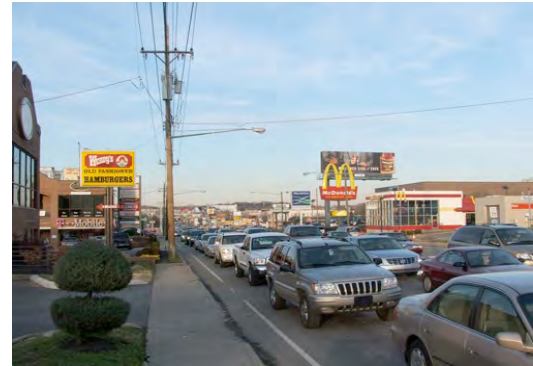
تصویر ۶. (قبل از اجرا) نمونه زیباسازی معبر در شهر گرین هیل آمریکا، قبل از اجرا؛ ماخذ: سازمان زیباسازی شهر تهران و جهاد دانشگاهی، ۱۳۹۱.