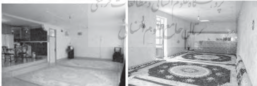
تصویر ۲. تغییر نگرش روستایان نسبت به زندگی وسیعی در شبیه کردن خانه‌های خود به مسکن شهری