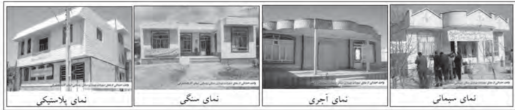
تصویر ۳. نمونه هایی از واحدهای مسکن روستایی از محل تسهیلات طرح ویژه با مصالح متنوع به ترتیب: سیمانی، آجری، سنگی و حتی پلاستیکی؛ مأخذ: آرشیو بنیاد مسکن

سازه‌ای طرح‌ها، سخت‌گیر بوده و اجرای آنرا اولویت اول می‌گردد.