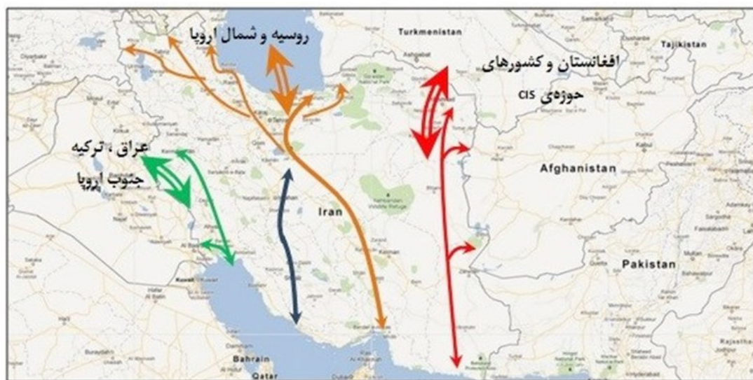
نقشه ۲. ساختار ارتباطی موجود و ظرفیت بندر چابهار.

علاوه بر موارد ذکر شده قراردادهای دو جانبه ایران - ترکمنستان و ایران - هندوستان نیز بر اهمیت نقش ارتباطی این منطقه افزوده است (شمشیرپناه، ۱۳۸۲، ص ۷۴). پروژه خط لوله صلح شامل انتقال گاز ایران از طریق پاکستان به هندوستان است، در این طرح قرار است خط لوله گاز از طریق بلوچستان ایران وارد خاک پاکستان شود و از آنجا به هندوستان برسد. اما این طرح به دلیل چالش‌های ژئوپولیتیک موجود بین پاکستان و هندوستان، ناامنی‌های موجود در ایالت بلوچستان پاکستان و قراردادهای اخیر پاکستان با چین توجیه‌پذیری خویش را در آینده از دست خواهد داد. سرمایه‌گذاری قابل توجه چین در رقابت با هندوستان و اتصال بندر گوادر پاکستان به چین اجرای پروژه خط لوله صلح را به تعویق انداخته است و سرانجام آنرا منتفی می‌سازد. چین دومین مصرف‌کننده جهانی نفت است و تمام نفت مورد نیاز آن از اقیانوس هند می‌گذرد. این کشور روزانه ۷/۳ میلیون بشکه نفت وارد می‌کند که ۵۰ درصد آن از عربستان سعودی تأمین می‌شود. از سوی دیگر ۸۵ درصد صادرات چین از راه اقیانوس هند می‌گذرد (احمدی نوحدانی و کاوندکاتب، ۱۳۸۹، ص ۱۴۳). انجام این سطح از مبادلات بین‌المللی در حوزه دریای عمان و نزدیکی بندر چابهار، پتانسیل